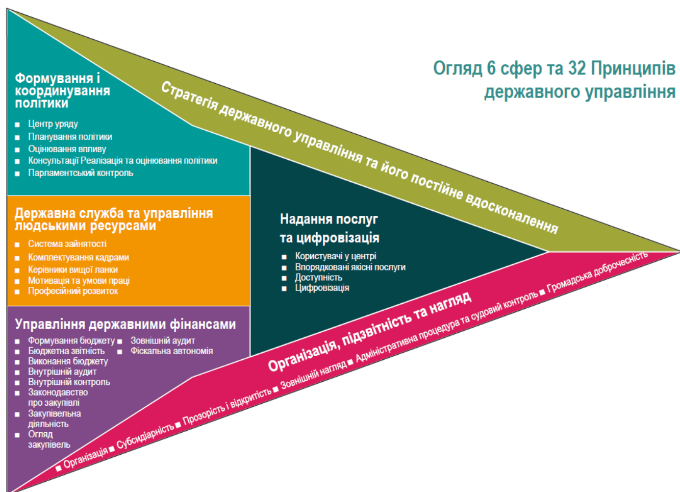
Рис.2.1. Структура Європейських Принципів державного управління від листопада 2023 року [45]

Прозорість і підзвітність – це основні принципи, які вимагають від публічних служб відкритості в процесі ухвалення рішень та відповідальності перед громадянами. Запровадження таких стандартів передбачає зокрема, вільний доступ до публічної інформації, що дозволяє громадянам контролювати діяльність органів влади та впливати на процес прийняття рішень. Директива 2013/37/ЄС про повторне використання інформації публічного сектору [32-34; 52] є прикладом європейського законодавства, що підсилює ці принципи. Важливим дороговказом для вироблення Європейські стандарти у сфері публічної служби стандартів є Європейські «Принципи публічного управління» від листопада 2023 року (див. Рис.2.1.) [45].