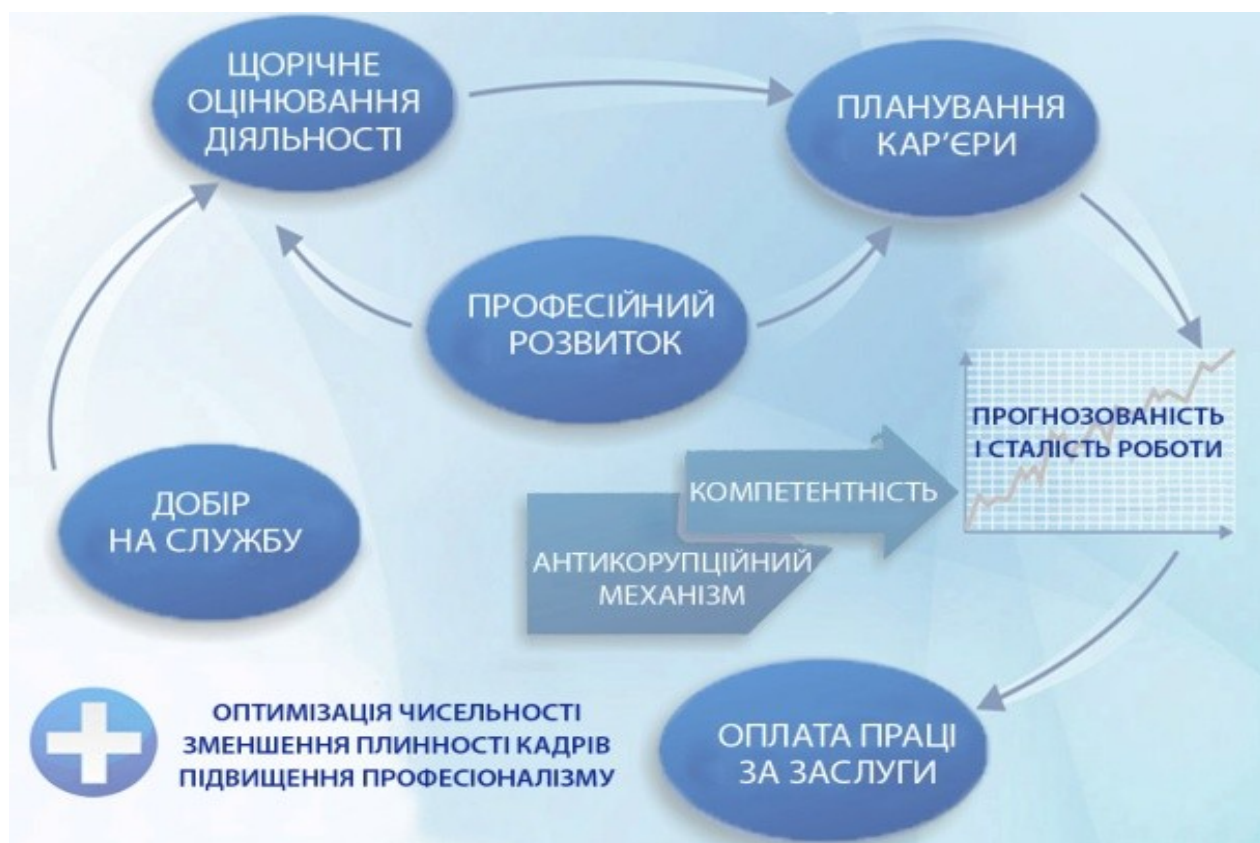
Рис.1.1. Напрямки системних змін у державній кадровій політиці [33]

3. Вдосконалення управління людськими ресурсами на державній службі України для залучення на неї та утримання кваліфікованих кадрів з метою розвитку професійної державної служби, що відповідає потребам суспільства та надає ефективні послуги населенню (Див.Рис.1.1).