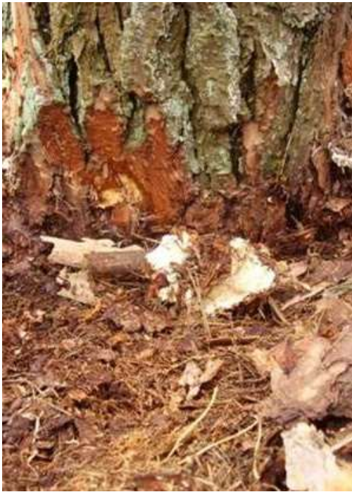
Рис. 4.1. Плодове тіло кореневої губки біля основи сухого дерева