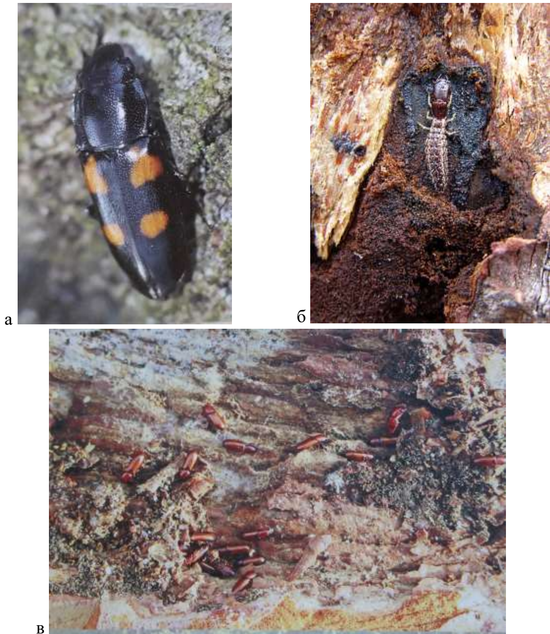
Рис. 5.2. Хижі ентомофаги у ходах короїдів: а – блищанка чотирьохкрапкова, б – личинка верблюдки; в – чорнотілка руда соснова

Поширення ентомофагів хижаків та паразитів відіграє важливу роль у регулюванні надмірної чисельності короїдів, однак без оперативного проведення санітарно-оздоровчих заходів цей процес може затягнутися на тривалий час.