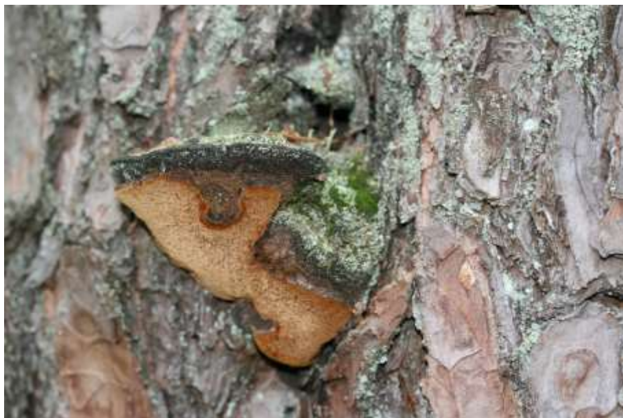
Рис. 4.3. Плодове тіло соснової губки

Дерева сосни на ділянці мають ознаки ураження кореневою губкою та сосною губкою (рис. 4.3). Ступінь ураження дерев – слабка. Під корою дерев є ходи короїдів шести зубчастого та верхівкового. На ділянці від загальної кількості дерев – 8,4 % свіжовсохлих та 6,3 % - сухостою минулих років.