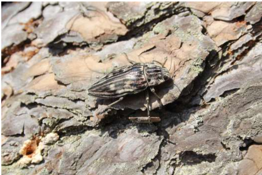
Рис. 3.4. Златка велика соснова