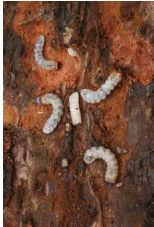
Рис. 3.3. Личинки вусача чорного соснового