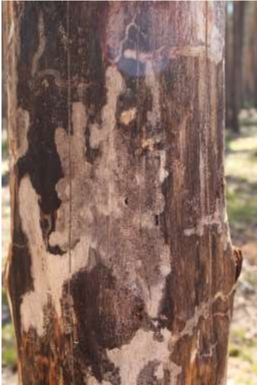
Рис. 3.2. Ходя синьої соснової златки

Доволі часто в насадженнях сосни трапляються синя соснова златка та вусач чорний сосновий (рис. 3.2-3.3). Златка велика соснова (рис. 3.4) у деяких країнах Європи охороняється, однак у насадженнях лісництва вона трапляється досить часто.