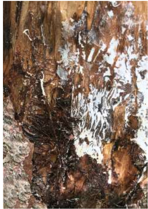
Рис. 4.2. Плівки і ризоморфи опенька під корою дерева сосни