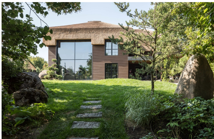
Рис. 3.1 — екстер'єр "The Shkrub House"