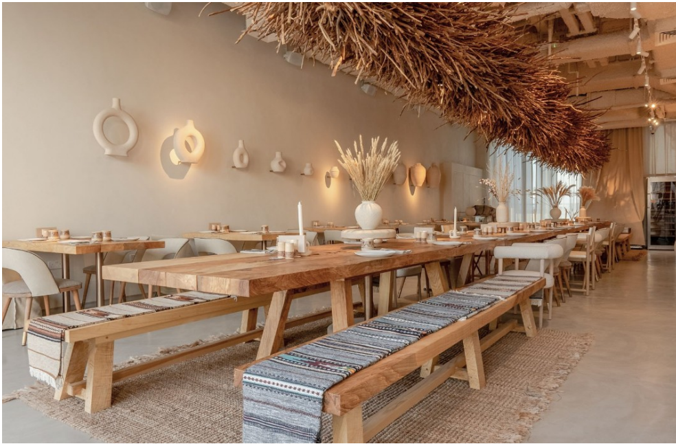
Рис. 3.3 — перший ресторан української кухні в Дубаї “YOY”

3. Victoria Yakusha та "живий мінімалізм" (Україна) Victoria Yakusha є провідною дизайнеркою, яка працює над інтеграцією українських культурних мотивів у сучасний контекст. Її філософія "живого мінімалізму" базується на використанні натуральних матеріалів, таких як глина, деревина, текстиль, а також автентичних технік, які відображають багатство української спадщини. [5]