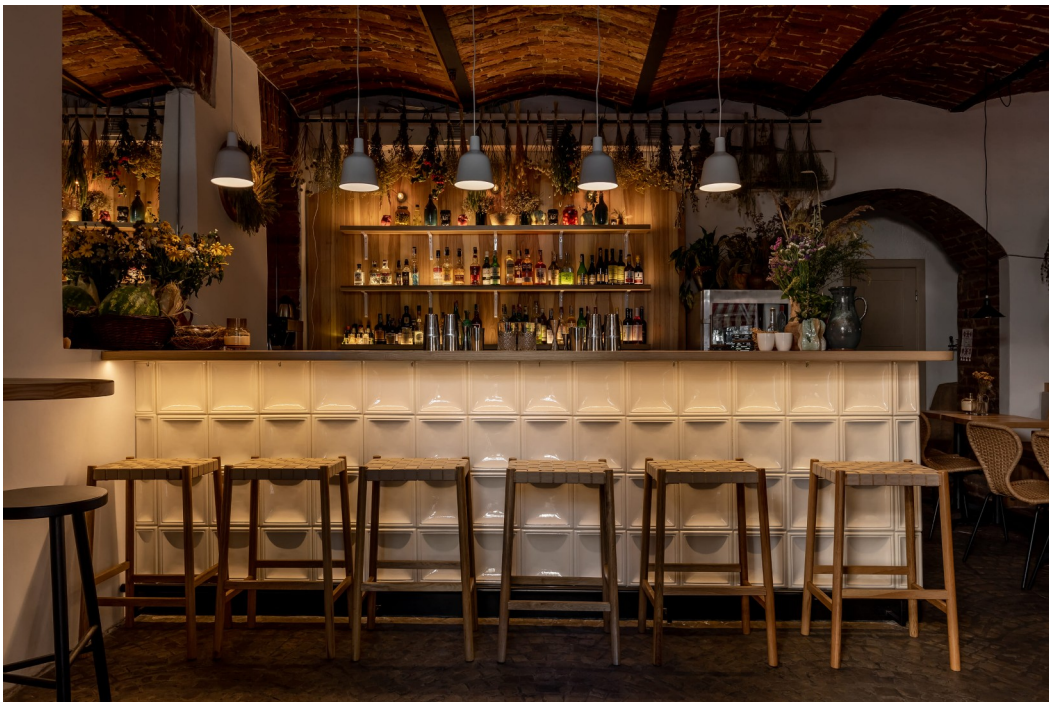
Рис. 3.11 — бар “Інші” м. Львів