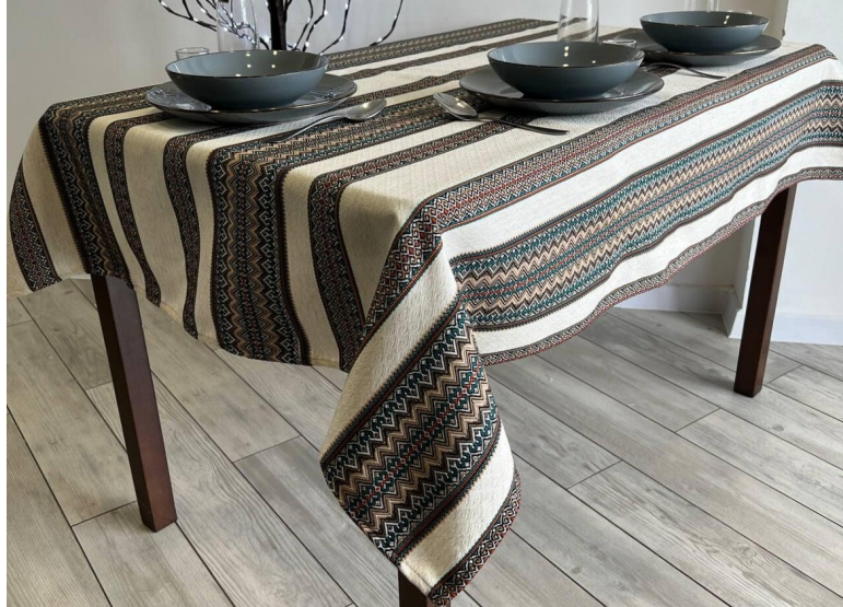
Рис. 1.10 — вишита скатертина

5. Текстиль: Ляні скатертини, домоткані килими та декоративні рушники є важливими елементами етнічного інтер'єру. Саме текстиль створює затишок у будинку, атмосферу свята та тепла.