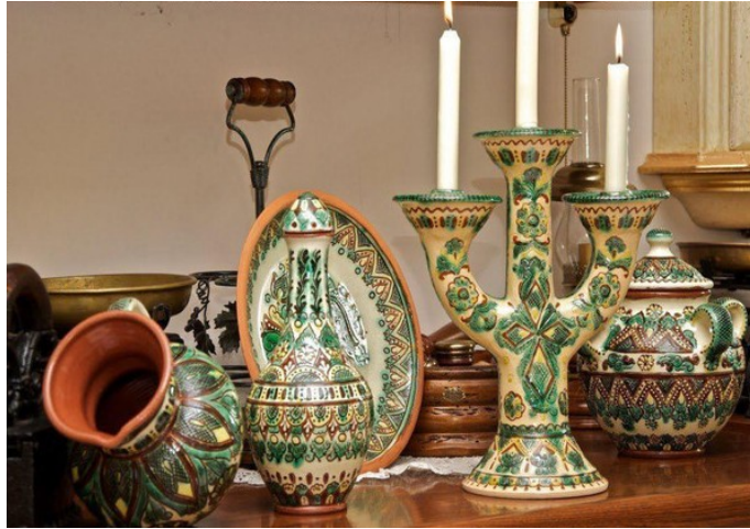
Рис. 1.8 - Косівський керамічний розпис