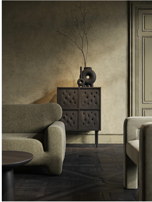
Рис. 3.6 — фрагмент інтер'єру Polyn

4. Ресторан "Каніпа" (Київ) Цей ресторан є зразком сучасного поєднання українських кулінарних традицій і дизайну. Інтер'єр закладу оформлений дерев'яними меблями, текстилем із вишивками, а також декоративними елементами, які відсилають до народного мистецтва. Декор включає унікальні вироби місцевих ремісників: гончарний посуд, ковані елементи та текстиль із вишивками, що доповнюють автентичний стиль простору. Це місце створює затишну атмосферу, приваблюючи як туристів, так і місцевих мешканців.[10]