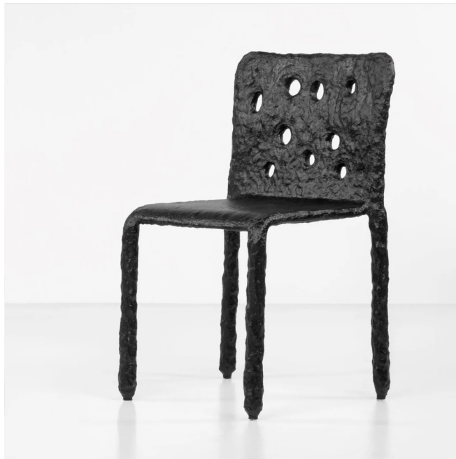
Рис. 3.4 — стілець колекції ZTISTA виліплений вручну з глини, сіна та інших перероблених матеріалів