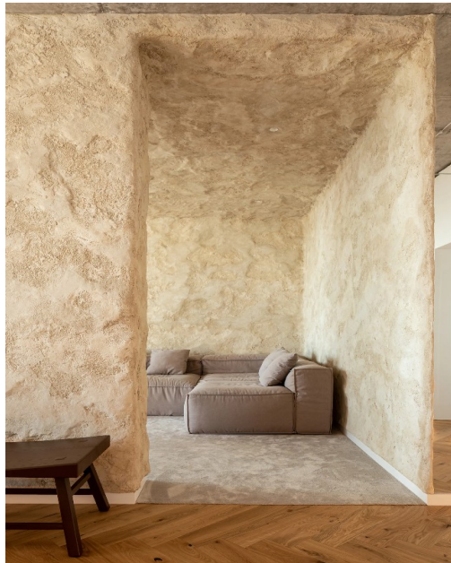
Рис. 3.1 — фрагмент глиняної штукатурки "Mazanka apartment"

текстиль із орнаментами Карпат. У поєднанні з мінімалістичними меблями і сучасним освітленням, дизайн створює гармонію між автентичністю й інновацією. Інший знаковий проект студії — "MAZANKA", де використано натуральні матеріали та елементи локального ремесла, такі як різьблені дерев'яні панелі та плетені аксесуари.[6]