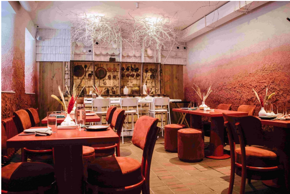
Рис. 3.10 — ресторан “100 років тому вперед” м. Київ