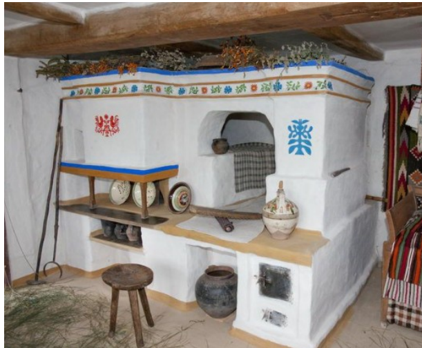
Рис. 1.9 — традиційна українська піч