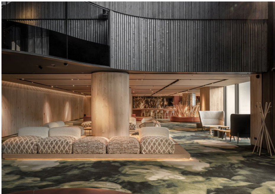
Рис. 3.2 — інтер'єр лоббі готелю "Emily Resort"