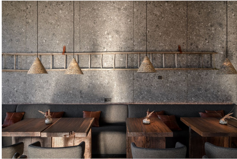
Рис. 3.1 — інтер'єр ресторану "HAY Boutique Hotel and SPA"