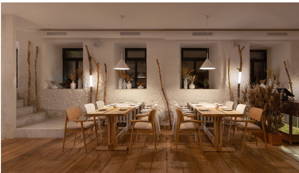
мис. 3.9 — ресторан "100 років тому вперед" м. Київ

5. Ресторани Євгена Клопотенка (Київ) Євген Клопотенко активно впроваджує етнічні мотиви в сучасний ресторанний дизайн. Наприклад, у ресторані "100 років тому вперед" використано керамічний посуд, дерев'яні меблі та автентичні орнаменти. Інший його заклад, "Інші", привертає увагу вишитими текстильними елементами та акцентами на локальних ремісничих техніках, що додають традиційного настрою до мінімалістичного простору. У ресторанах Клопотенка також застосовуються інноваційні підходи до організації простору, де етнічність не лише декор, але й концептуальна основа. [14]