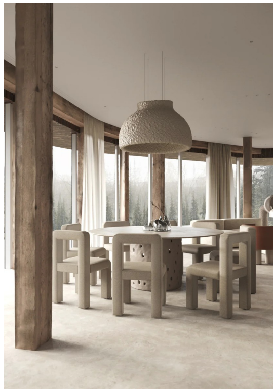
Рис. 3.5 — фрагмент інтер'єру VHORY