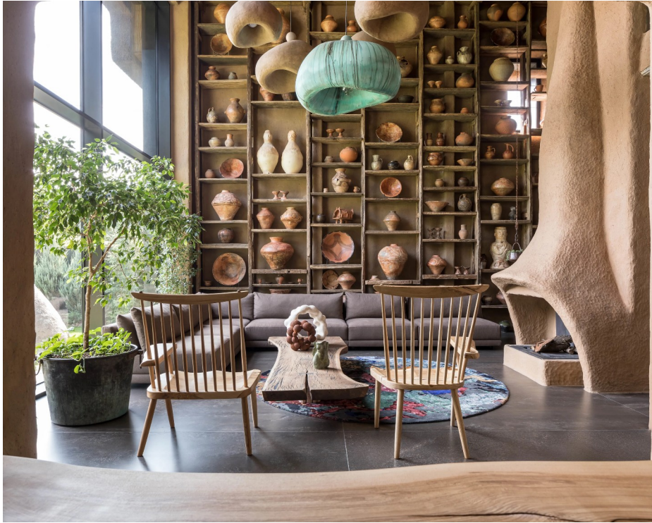
Рис. 3.1 — інтер'єр "The Shkrub House"

2. YOD Group (Україна) YOD Group демонструє вміння гармонійно поєднувати локальні традиції з сучасними дизайнерськими підходами. Один із найяскравіших проєктів — HAY Boutique Hotel and SPA у Харкові, де використано текстури дерева й каменю, а також декоративні елементи, натхненні українським народним мистецтвом. У ресторані YOY цього ж комплексу гармонійно поєднано традиційні орнаменти з мінімалістичними меблями й освітленням, підкреслюючи теплу, автентичну атмосферу. Ще одним прикладом є ресторан "NAMU", що інтегрує локальні мотиви через використання керамічного посуду та текстилю ручної роботи, що додає простору етнічного колориту. [7]