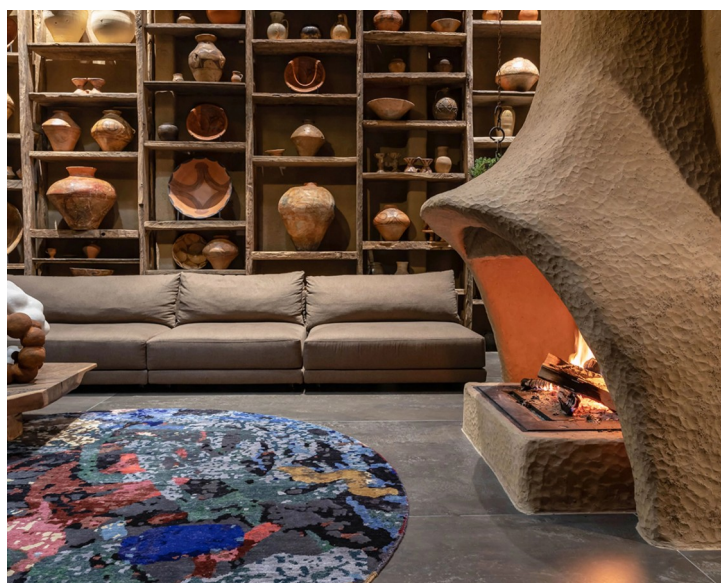
Рис. 1.12 — піч у “Shkrub House”