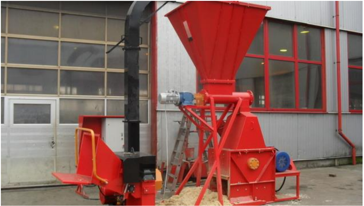
Рисунок 2.3. Загальний вигляд комплексу DP 660 МК