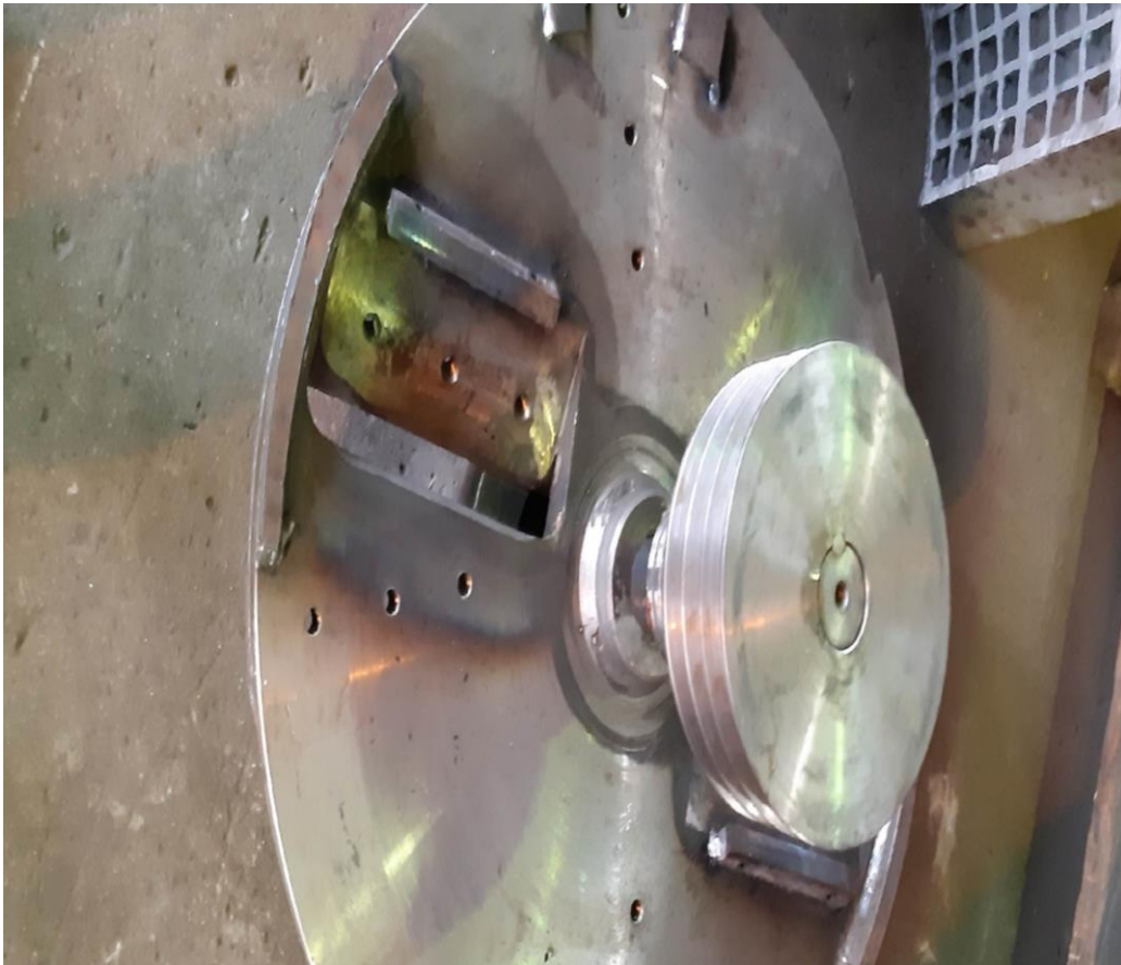
Рисунок 2.4. Загальний вигляд рубального диску з ножами

Рубальна машина оснащена 4-ма лопастями для відведення технологічної тріски. За допомогою відцентрового прискорення лопастей технологічна тріска подається через тріскопровід в бункер-дозатор. В подальшому за допомогою шнека технологічна тріска поступає в молотковий подрібнювач. Привід подрібнюючого ротора здійснюється від електродвигуна, через клиноремінну передачу. Ротор молоткового подрібнювача складається з центрального вала і дисків конструктивно пов'язаних з чотирма осями, на кожній з яких вільно обертаються молотки. За рахунок відцентрової сили дробильні молотки стають в радіальне положення і технологічна тріска яка поступає в робочу зону подрібнюється на фракцію заданих розмірів. Готова подрібнена деревина заданих розмірів (фракційності) проходить через комірки сита і за допомогою відцентрового аспіраційного вентилятора видаляється з молоткового подрібнювача. Досягнення необхідних розмірів подрібненої деревини