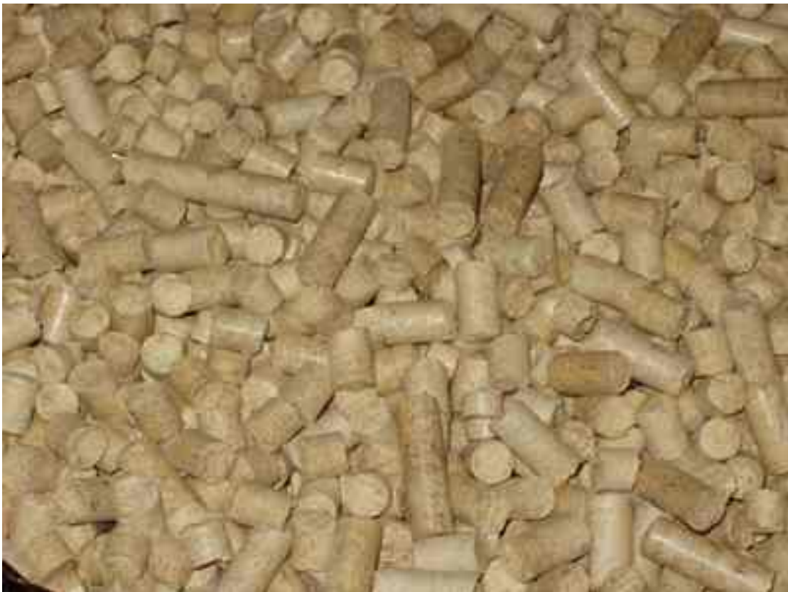
Рисунок 1.1 Загальний вигляд деревних паливних гранул (світлих).

Виготовлення виробів з деревини завжди пов'язане з отриманням певного виду відходів на різних стадіях виконання технологічних операцій. Для прикладу, за типового лісопильно-розкрійного процесу (виготовлення обрізних чи необрізних пиломатеріалів з круглих лісоматеріалів) близько 60% колод перетворюється на дошки, при цьому ми отримуємо до 12% тирси, майже 6% перетворюються у кінцеві обрізки та 22% становлять горбилі і обзолні рейки. На сьогодні переробка відходів на паливні деревні гранули економічно вигідне виробництво поза як гранули мають суттєві переваги якщо їх порівнювати з іншими видами палива: