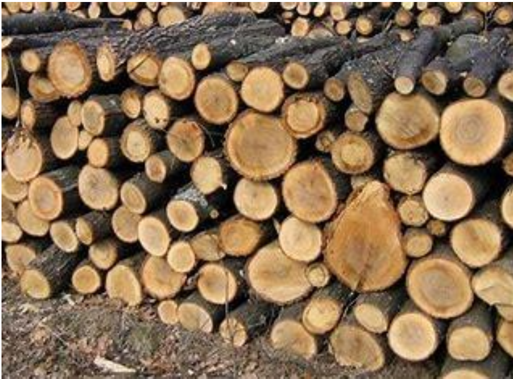
Рисунок 2.1. Загальний вигляд дров'яної деревини.

Для проведення виробничих експериментальних досліджень використовувалися дров'яна деревина (круглі лісоматеріали) та кускові відходи (обзолні рейки, горбилі, відрізків після торцювання пиломатеріалів). Загальний вигляд дров'яної деревини, яка використовувалася в дослідженнях показаний на рисунку 2.1.