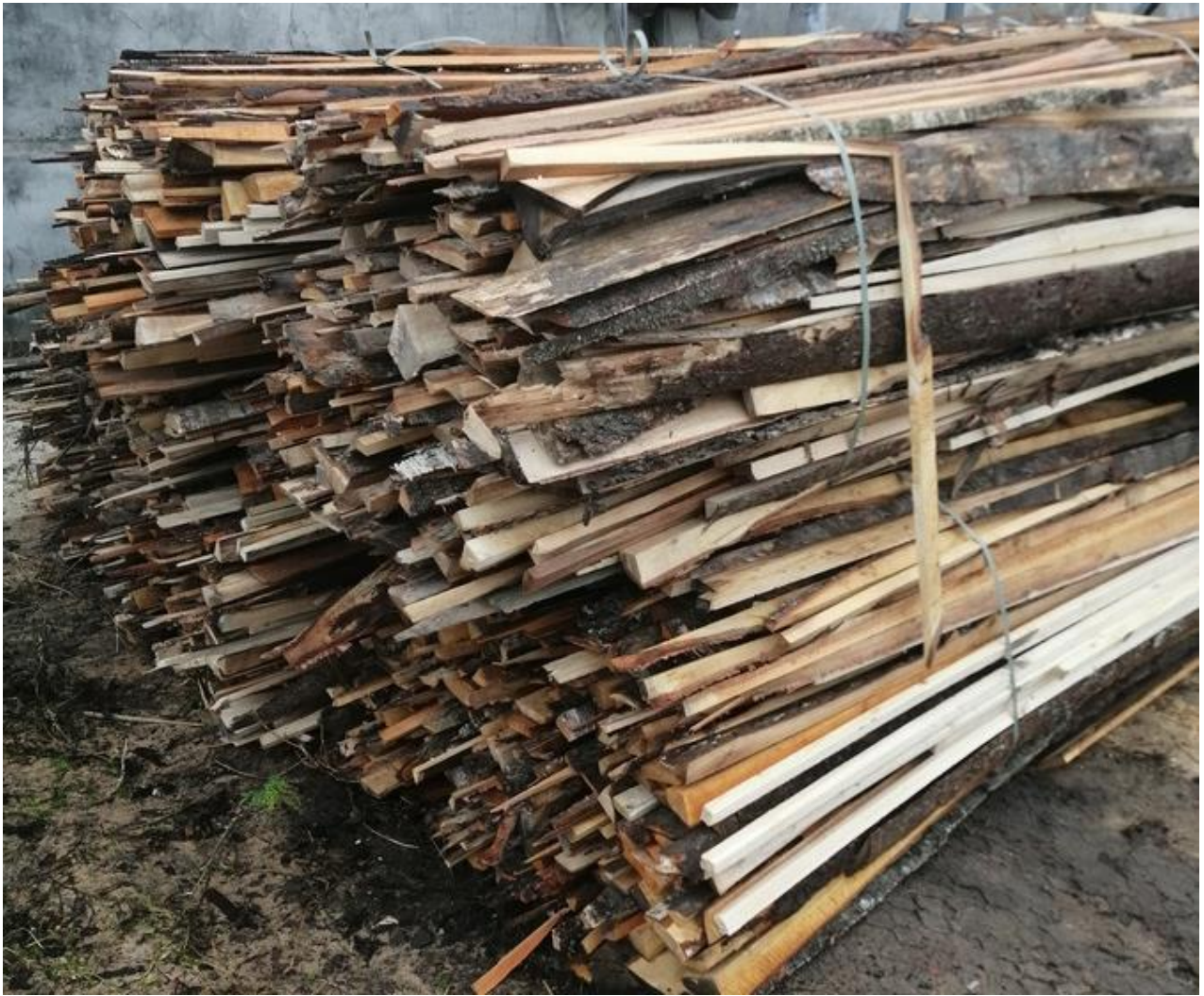
Рисунок 2.2. Загальний вигляд деревинних кускових відходів.