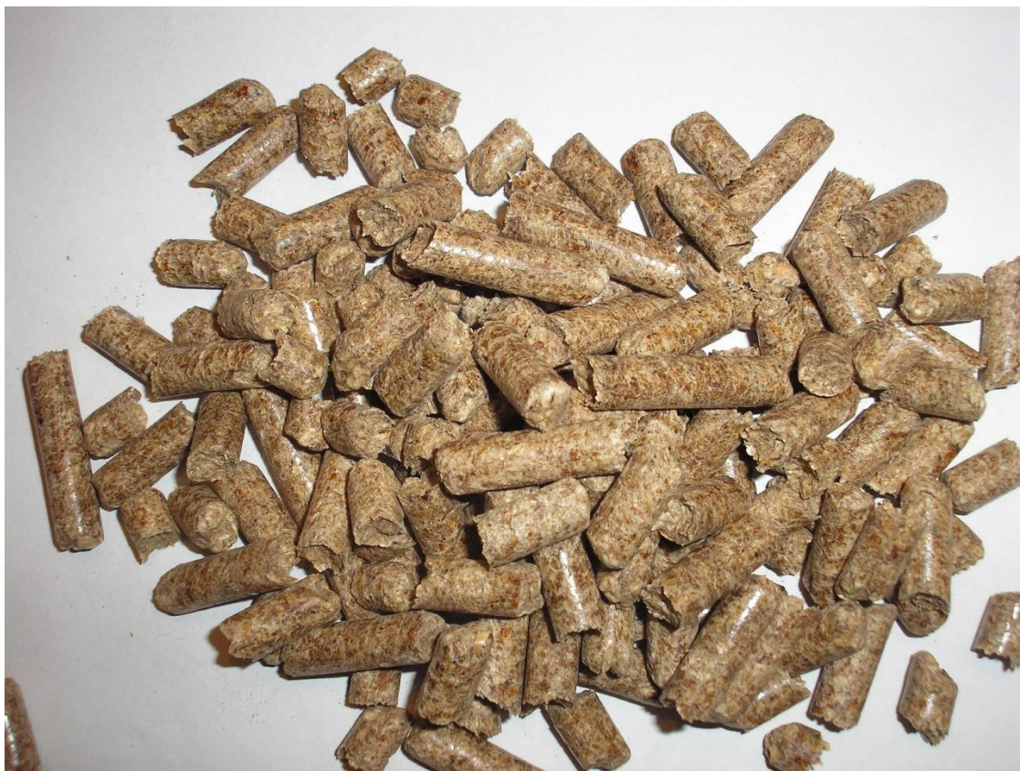
Рисунок 1.2. Загальний вигляд деревних паливних гранул (темних) які мають вміст кори або подрібнена деревина висушувалася в барабанних сушарках з температурою сушильного агента 450-540 °С.