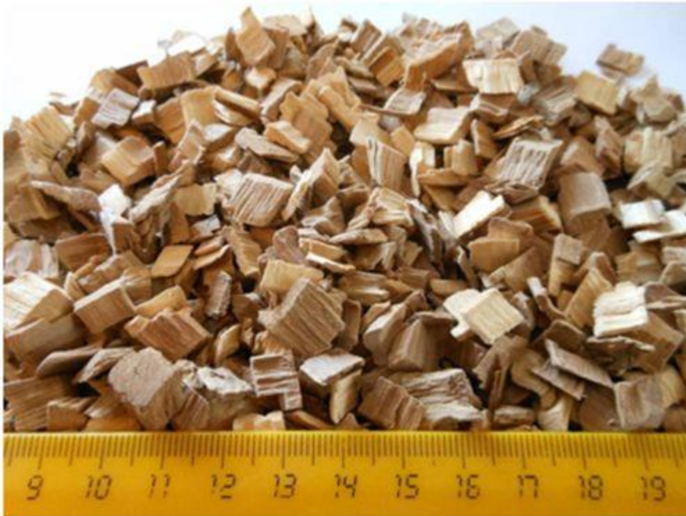
Рисунок 1.3. Загальний вигляд технологічної тріски.

Висушувати технологічну тріску таких розмірів в будь-яких типах сушарок (барабанні, стрічкові, аерофонтанні) не доцільно за наступних обставин. По перше, це значно збільшить тривалість сушіння і, як наслідок, приведе до надмірних витрат теплової і електричної енергії. По друге, різноманітність розмірів (фракційності) технологічної тріски не дозволяє забезпечити рівномірність необхідної кінцевої вологості матеріалу. В магістерській роботі передбачається виконати дослідження з визначення зміни розмірів технологічної тріски в залежності від кількості ножів на диску рубальної машини і швидкості подачі оброблювальної сировини. Для доведення фракційності технологічної тріски до заданих розмірів виконують її доподріблення на молоткових подрібнювачах з використанням різних розмірів комірок сита. Проведення таких досліджень також буде виконано в магістерській роботі. Одним з недоліків такого способу отримання кондиційної (певної фракційності) подрібленої деревини для виготовлення паливних гранул є часте забивання комірок сита подрібнювачів. Якщо подріблення сухої деревини не викликає забивання комірок, то при обробленні сирої технологічної тріски ця проблема стає нагальною. Особливо гостро постає дана