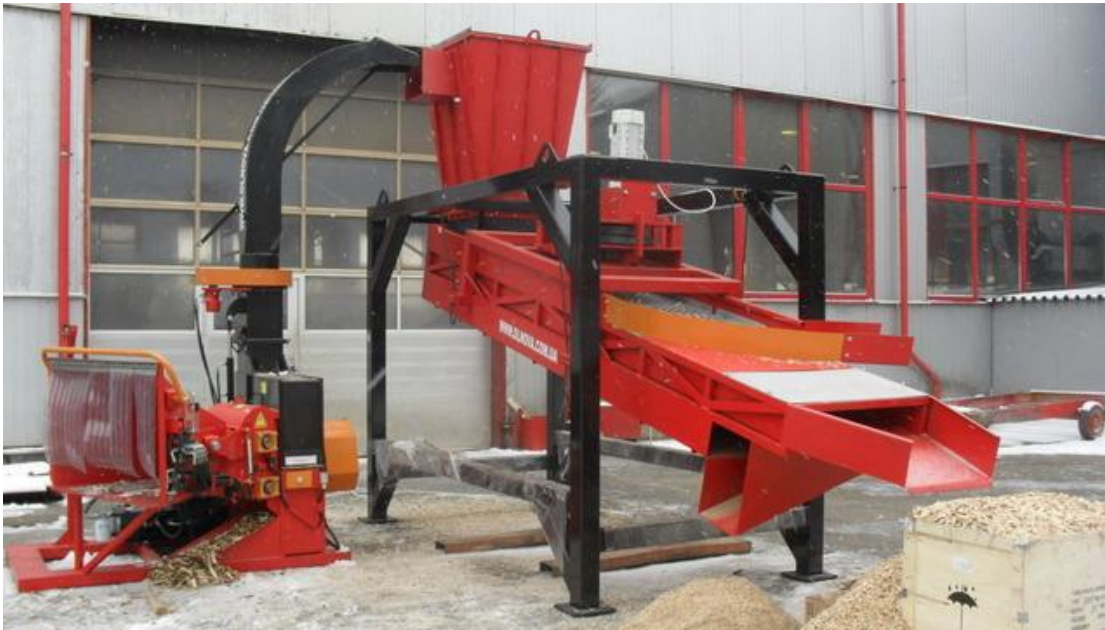
Рисунок 2.6. Комплекс DP 660 МК з вібраційним сепаратором подрібненої деревини.

В процесі проведення виробничих досліджень в склад комплексу замість дискової дробарки і молоткового подрібнювача була вмонтована рубальна машина роторного типу для вивчення можливості отримання подрібненої деревини заданої фракційності без додаткового подріблення в молотковому подрібнювачі.