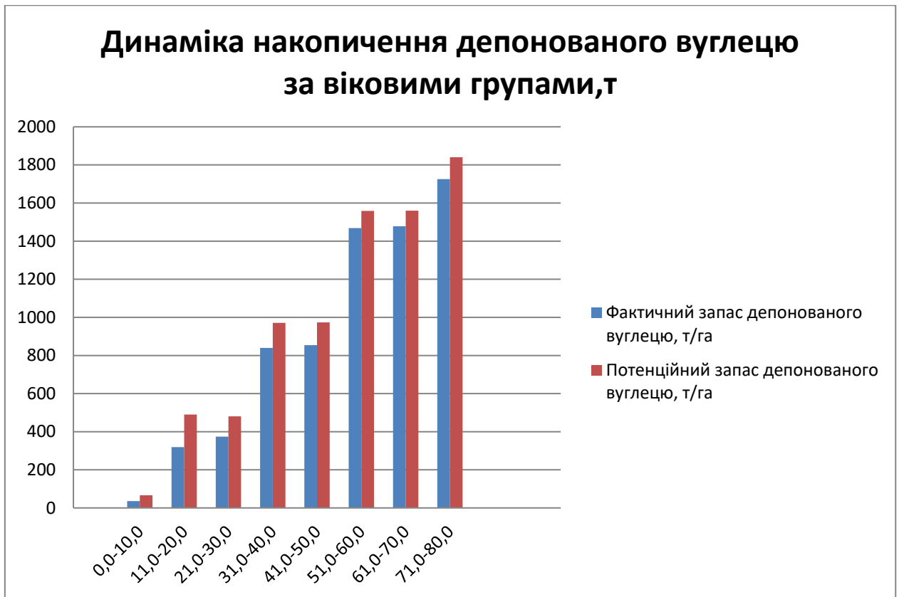
Рис. 4.2. Особливості накопичення депонованого вуглецю в насадженнях свіжого дубового субору Сварицевицького лісництва

В цілому структура накопичення депонованого вуглецю в межах деревостанів Сварицевицького лісництва представлена на рис. 4.2.