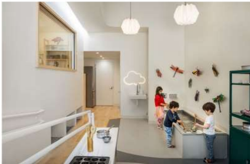
Додаток 2. Palette Architecture. «Wonderforest Nature Preschool».