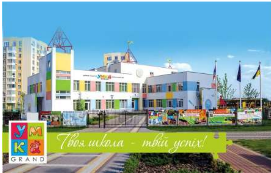
Рис. 2.2.4 Дошкільний навчальний заклад «Умка Гранд», ЖК Петровський квартал, Київ, 2016.

Дитячий садок призначений для 160 дітей і повністю відповідає всім необхідним стандартам якості. Дитячий садок обладнаний спеціальними тактильними смугами для дітей з інвалідністю, настінними інформаційними табличками з контрастними зображеннями, а також обладнаний підйомником для перевезення дітей на візках. Крім того, у садку є власний басейн, який був запроєктований з урахуванням вимог, щодо доступності. Однією з особливостей цього закладу є максимальне використання природного освітлення[21].