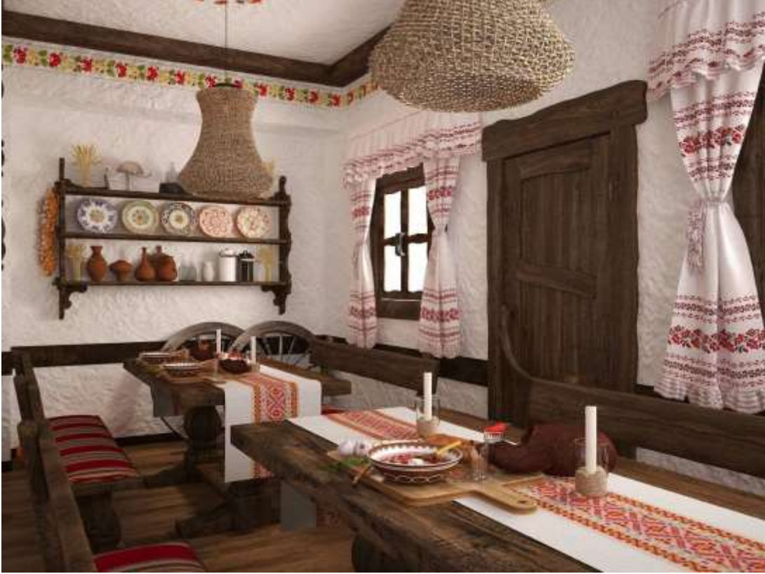
Додаток 6. Зразок інтер'єру в стилі української хати.