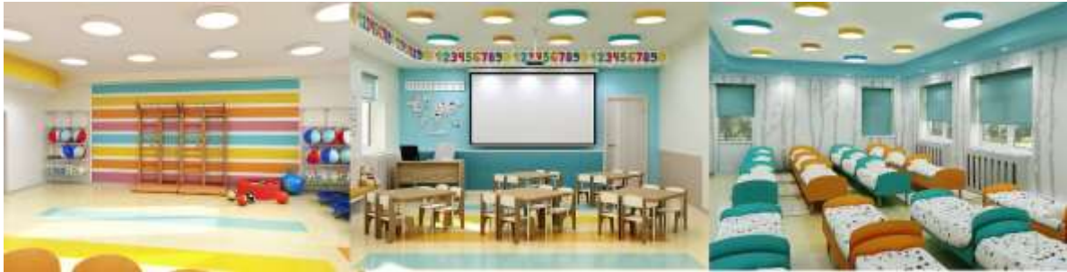
Рис. 2.2.6 Дитячий садок с. Старі Кодаки.

"Велике будівництво", ініційованої президентом України Володимиром Зеленським [23].