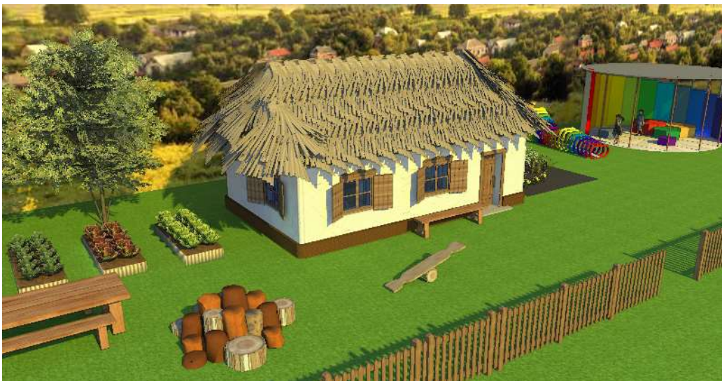
Додаток 9. Авторська розробка. Екстер'єр навколо хати мазанки.