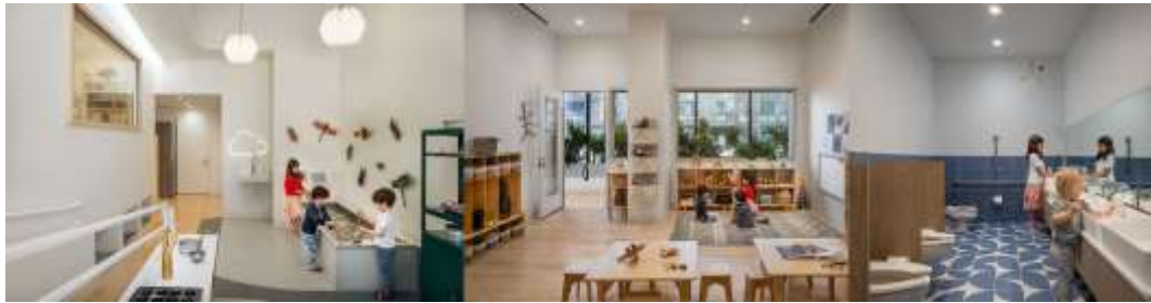
Рис. 2.2.9 Palette Architecture. «Wonderforest Nature Preschool». м. Брукліні, Америка.

спускається навколо болотистої землі. На відміну від більш офіційної поведінки в інших зонах, The Wetland є міцним, вологим простором, який заохочує дітей занурюватися в тактильну гру та сенсорні дослідження, зосередженості на плавучості, динаміці та творчості. Водяний стіл дитячого розміру та грязьова кухня сприяють грайливим безладним пригодам, що імітують суть досвіду паркового ставка (рис. 2.2.9.).