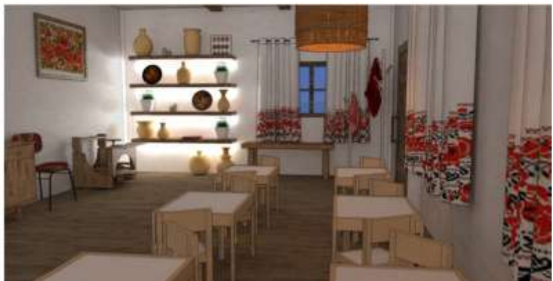
Додаток 8. Авторська розробка. Інтер'єр хати мазанки.