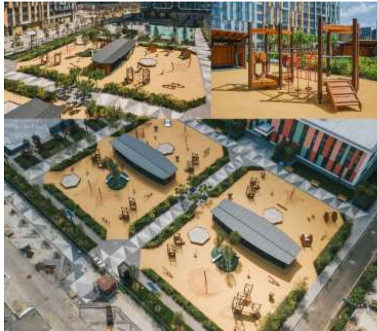
Рис.3.3.3 Дитячий майданчик Respublika Kids, м. Київ.

Ексклюзивно для цього проекту на замовлення були розроблені два двосторонні накриття. При цьому одна з них мала форму амфітеатру (Рис.3.3.3).