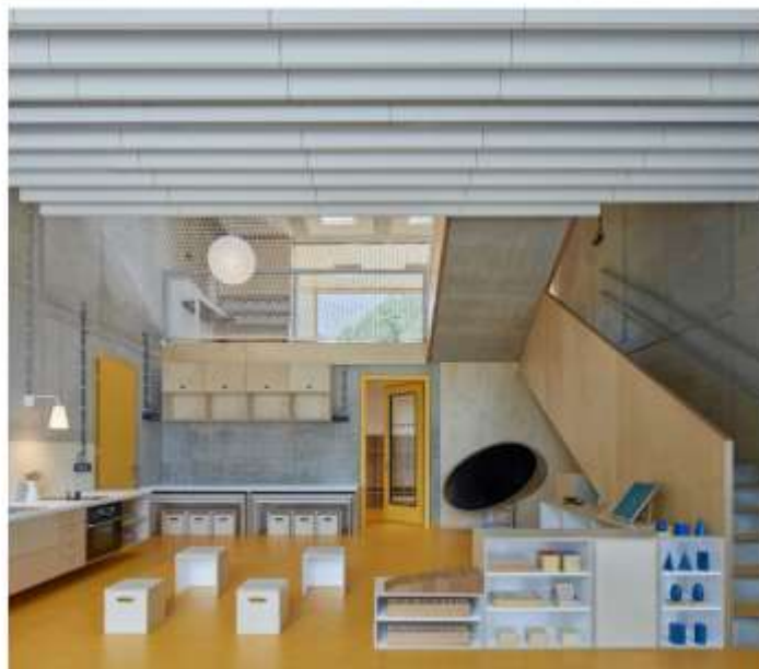
Додаток 3. Дитячий садок за методикою Монтессорі. м. Яблонці-над-Нісою, Чеська Республіка.