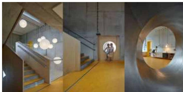
Рис. 2.2.11 Дитячий садок за методикою Монтесорі. м. Яблонці-над-Нісою, Чеська Республіка.

Всередині над основним приміщенням першого поверху височіє центральна порожнеча, оточена серією мезонінів, кожен з яких піднімається на половину сходів від останнього. Будівля має на меті заохотити дитину досліджувати, дозволяючи дитині знайти себе в середовищі, яке їй подобається.