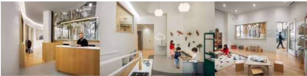
Рис. 2.2.8 Palette Architecture. «Wonderforest Nature Preschool».

Дитсадок був задуманий як «перший об'єкт у своєму роді», у процесі проектування Palette Architecture зіткнулися з такими проблемами, пов'язані із перенесенням природи в архітектурне середовище, так званої міської вітрини. Підхід фірми почався з фокусування на тому, щоб вписати принципи природного осередку у фізичні обмеження антропогенного середовища. Взявши на озброєння стратегію абстрактної природи, вони взяли за відтворення палітри та текстур природи через спрощені біонічні форми, які дозволяють дітям вчитися через взаємодію з водою, деревами, брудом і колективним ландшафтом (рис.2.2.8).