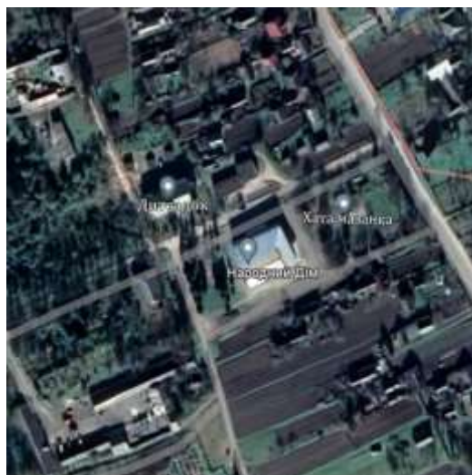
Рис. 3.4.1 Ситуаційний план.

Територія на якій розташована хата мазанка знаходиться в Львівській області, село Добростани, біля якого розташований Народний дім села та навпроти через дорогу комунальний дошкільний заклад. (рис. 3.4.1.).