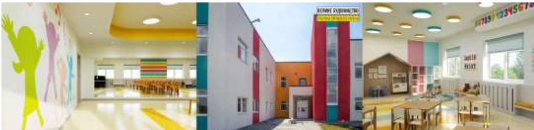
Рис. 2.2.5 Дитячий садок с. Старі Кодаки.

Діти можуть вільно використовувати свій час на факультативах та секціях, таких як шахи, робототехніка, кек-аеробіка, ментальна арифметика, вокал. А батьки завжди можуть перевірити, як проводить час їхня дитина, завдяки системі відеоспостереження у садочку. Цей садок є приватним, але за рахунок зовнішнього вигляду замку та умов, яких надає цей заклад, на нашу думку діти будуть в захваті навчатись та пізнавати світ в такому осередку [22].