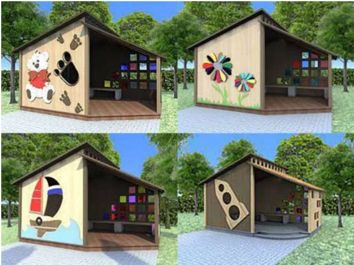
Додаток 4. Проект павільйону, фірма «АРТ-Бастион».