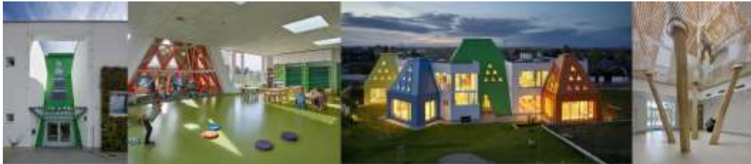
Рис. 2.2.13 Дитячий садок Větrník, м.Річани, Чеська Республіка.

Дитячий садок Větrník, розташований у Річанах, містечку в районі Прага-Схід, має тренажерний зал, сад, класні кімнати та ігровий майданчик, розташований між кольоровими блоками, які відходять від центральної білої споруди. Його дизайн нагадує дитинство, а композиції створюють грайливість і спонтанність, а форми імітують берлоги та намети (рис. 2.2.13.).