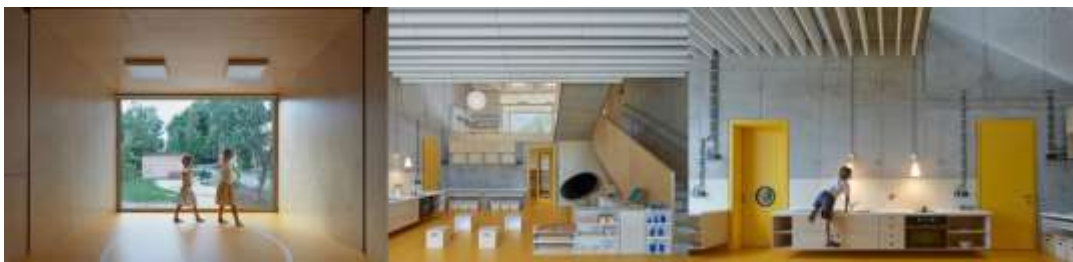
Рис. 2.2.12 Дитячий садок за методикою Монтессорі. м. Яблонці-над-Нісою, Чеська Республіка.

Подібним чином інший ігровий простір має карту світу, вліплену прямо в бетонну стіну, щоб сприяти навчанню за допомогою зору та дотику. Щоб спроектувати цю архітектурну споруду, архітектор порадився зі своїми маленькими дітьми, щоб дізнатися, що вони вважають найкращим для себе. Розробляючи дизайн для дітей, ви повинні виконати домашнє завдання щодо безпеки, ефективності та всього іншого, але пам'ятайте, що єдина причина для дизайну – це заохотити дітей до гри. Чим кращий дизайн, тим більше ви дозволяєте дітям робити та зацікавлено грати між собою (рис. 2.2.12).