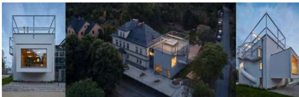
Рис. 2.2.10 Дитячий садок за методикою Монтесорі. м. Яблонці-над-Нісою, Чеська Республіка.

«Ми особливо пишаємося відчутними перевагами Wonderforest для майбутніх поколінь, а також його внеском у просування нових концепцій у світі дизайну, які охоплюють бачення кращого світу», — підсумував Пітер Міллер. «Було зроблено багато роботи, щоб знайти способи органічно поєднати антропогенне середовище з природним середовищем, але цей проект успішно повернув цей потік, залучивши природу в міське середовище» [24].