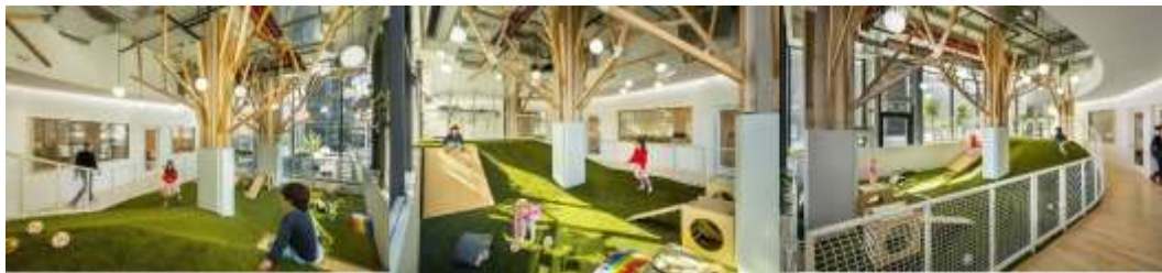
Рис. 2.2.7 Palette Architecture. «Wonderforest Nature Preschool».

Перейдемо до зразків архітектур та інтер'єру в Америці та Європі. Palette Architecture створила абстрактну природу для дітей дошкільного віку в Брукліні, Америка.