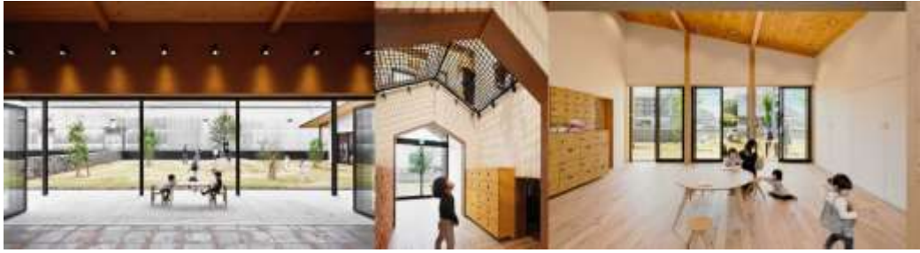
Рис. 2.2.16 Дитячий садок в Маебасі, Японія.

Внутрішнє оздоблення, включаючи штукатурку, подібне до глини, меблеві вироби з яскраво вираженою зернистістю додають природних тонів і тактильних поверхонь у всьому просторі. У такому комфортному середовищі діти можуть самостійно відчутти зміну пори року та виховати в собі чуттєвість. В той же час вони можуть мати шанс доторкнутися до матеріалів і дізнатися про їхню культуру. Кремезний дерев'яний каркас будівлі залишився відкритим і доповнений деревом, використаний для стелі, сховищ, шаф та дерев'яної плити, нанесеною на стіни ванної кімнати [28].