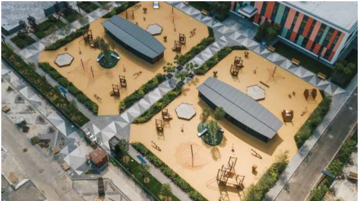
Додаток 4. Дитячий майданчик Respublika Kids, м. Київ.