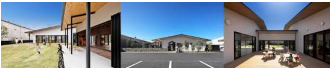
Рис. 2.2.15 Дитячий садок в Маебасі, Японія.

Сильний схил ділянки проектується у дві великі горизонтальні площини. Нижня закріплена в оригінальному рельєфі, розміщуючи приміщення для обслуговування, а вища дає місце для власного використання даного центру, піднімаючи їх із існуючої топографії. Обидві площини перетинають чотири великі діагональні стіни, які організують простір для дошкільної програми. Від цього перехрестя дитячий садок розгортається як безперервність великих простір, який розкриває свій інтер'єр, як нову архітектурну географію [27].