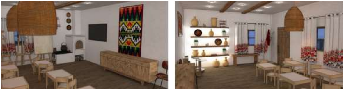
Рис.3.4.2. Інтер'єр хати мазанки.

по периметру дерев'яними прутами. На підвір'ї хати облаштували зону квітника та городу, для залучення дітей до сільського господарських робіт.(рис.3.4.3).