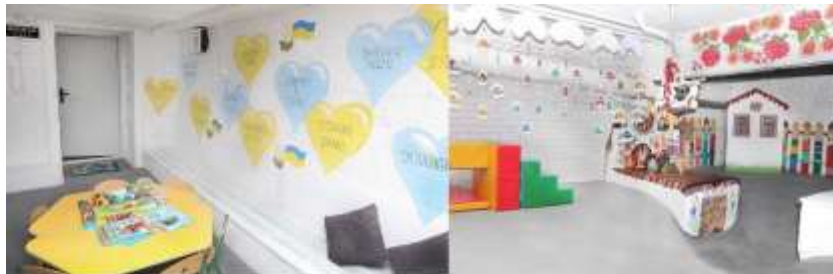
Рис. 2.2.19 Укриття в дошкільному закладі. м. Вінниця.

Ось приклад укриття у Вінниці в дошкільному навчальному закладі, який після повномасштабного вторгнення відновив свою роботу (рис.2.2.19).