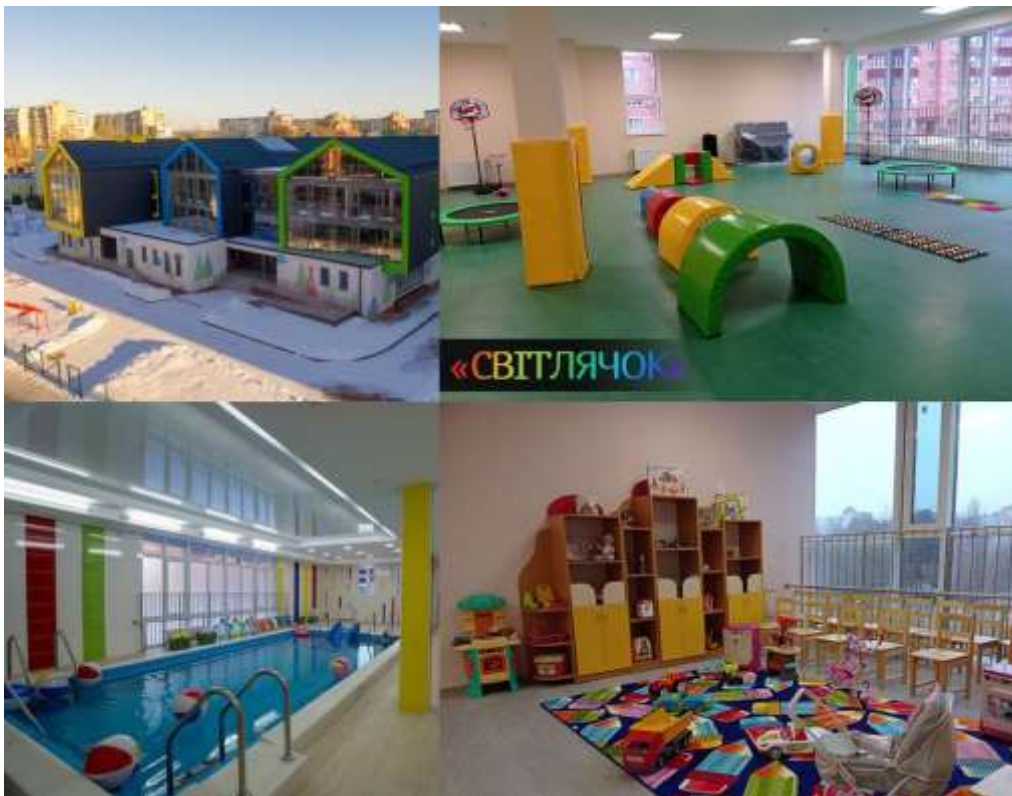
Рис. 2.2.3 Дитячий садок в Сумах « Світлячок ».

Також, у Сумах розпочав свою роботу новозбудований дитячий садок під назвою "Світлячок" (рис. 2.2.3). Цей садок був розроблений місцевими архітекторами та дизайнерами в рамках програми "Велике будівництво"