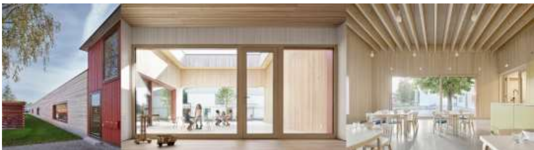
Рис. 2.2.18 Дерев'яний дитячий садок в Брегенці, Австрія.

Серцем кожної групи є кімната на відкритому повітрі біля переходу до саду, навколо якої розташовані група та альтернативна кімната, щоб створити цілісну функціональну одиницю. Ці кімнати вирізняються високою стелею, яка обмежується дерев'яними балками, які створюють контрастні умови відносно нижньої висоти простору коридору. У той час як коридори та бічні зони базуються на існуючій висоті кімнат, на значне підвищення групових і зовнішніх приміщень створює нову просторову якість. Видимі балки з місцевої деревини та збірні зовнішні стінові елементи надають новим кімнатам міцного студійного характеру з існуючою та розширеною зоною, перетворюючи простір в одне ціле.