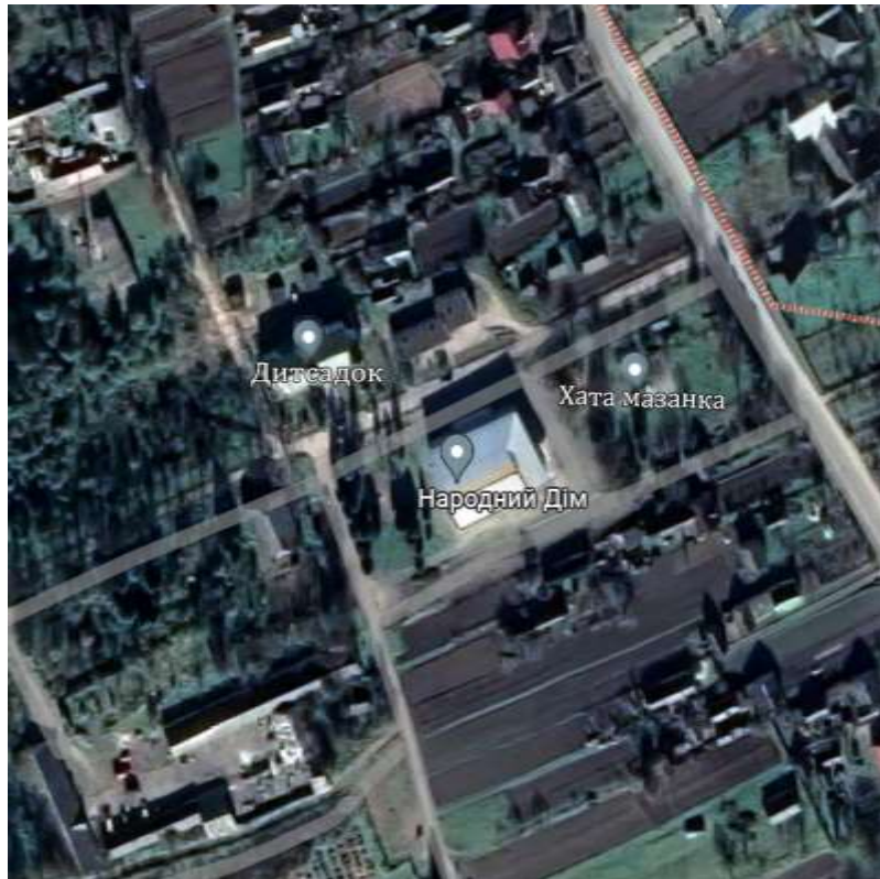
Додаток 5. Ситуаційний план село Добростани