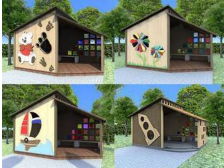
Рис. 3.3.2 Проект павільйону, фірма «АРТ-Бастион».

кількості дітей у групах та розмірів ігрового майданчика. Важливо детально продумати інтер'єр та екстер'єр закритого навісу, щоб забезпечити комфорт для дітей і створити середовище, яке сприяє їх розвитку та підтримує позитивний настрій[39].