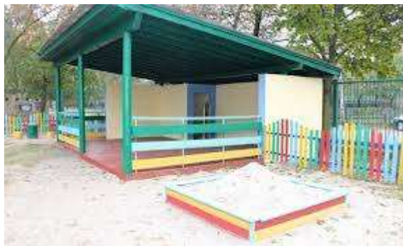
Рис. 3.3.1 Вигляд павільйону в м. Черкаси.

використання майже за будь-якої погоди, окрім сильних морозів, злив та шквалів вітру. Дизайн павільйону та малих архітектурних форм на території дитсадку враховує ряд ключових аспектів, спрямованих на створення комфортного та безпечного середовища для дітей. Павільйон зазвичай вирізняється естетичним оформленням, яке відповідає дитячій тематиці та сприяє позитивному враженню. Павільйон має мати яскраві кольори, що стимулюють розвиток дитячого відчуття краси, також мати безпечні та м'які форми, щоб уникнути травматичних ситуацій. До прикладу, ось так виглядає більшість павільйонів на території України (Рис.3.3.1).