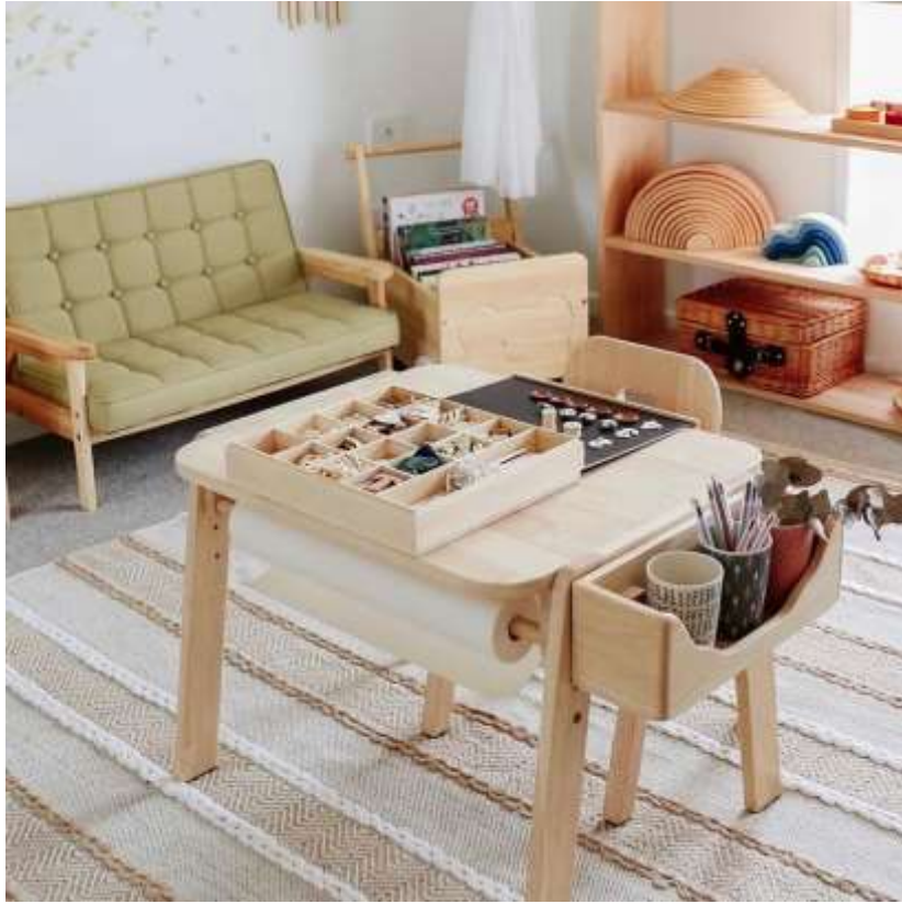
Додаток 7. Приклад столики для дитячої творчості.