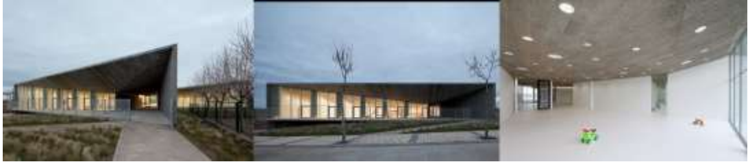
Рис. 2.2.14 Дошкільний заклад у Аро, Іспанія.

творчій грі. Зусилля полягали в тому, щоб спроектувати житлову зону, повну розважальних атракціонів, лазанок та ігрових елементів, своєрідний ландшафт дитячої фантазії, можливо, навіть парк розваг. Побудований дошкільний заклад, є дійсно ігровим та дасть змогу розвивати креативність у дітей [26].