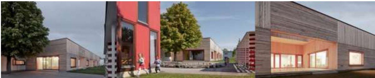
Рис. 2.2.17 Дерев'яний дитячий садок в Брегенці, Австрія.

Внутрішнє оздоблення, включаючи штукатурку, подібне до глини, меблеві вироби з яскраво вираженою зернистістю додають природних тонів і тактильних поверхонь у всьому просторі. У такому комфортному середовищі діти можуть самостійно відчутти зміну пори року та виховати в собі чуттєвість. В той же час вони можуть мати шанс доторкнутися до матеріалів і дізнатися про їхню культуру. Кремезний дерев'яний каркас будівлі залишився відкритим і доповнений деревом, використаний для стелі, сховищ, шаф та дерев'яної плити, нанесеною на стіни ванної кімнати [28].