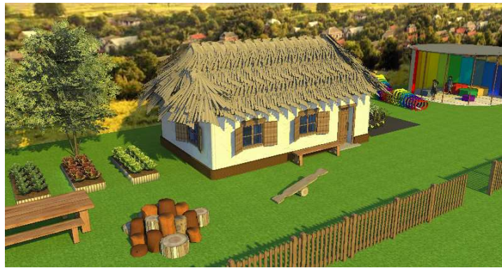
Рис.3.4.3. Екстер'єр хати мазанки.

Залучення дітей до українських ремесл має кілька важливих переваг і може мати позитивний вплив на їхній розвиток та формування. В першу чергу це збереження культурної спадщини. Залучення дітей до українських ремесл допомагає передавати і зберігати традиції, ремесла та родинні значення, що є важливою частиною культурної спадщини [47].