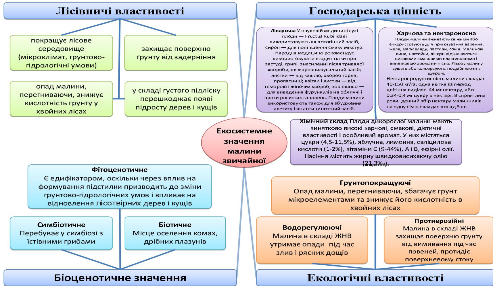
Рис. 1.1. Екосистемне значення малини звичайної