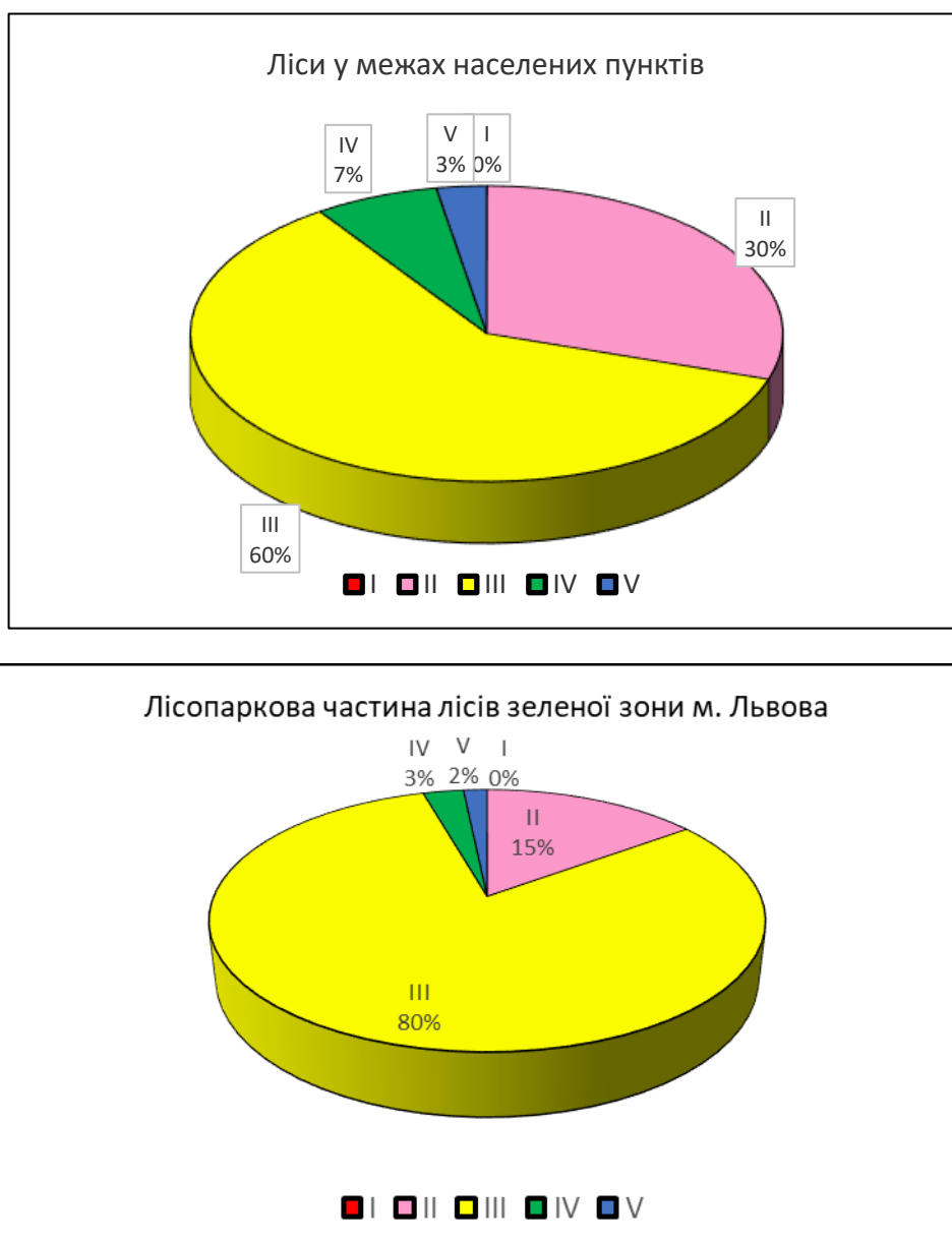
Рис. 3.2. Розподіл території Брюховицько-Львівського лісництва за класами природної пожежної небезпеки

На основі обраховано середнього класу природної пожежної небезпеки кожного кварталу (табл. 3.4) складено Пожежну карту лісництва (рис. 3.3).