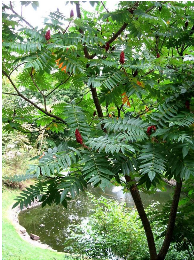
Рис. 4.24. Сумах пухнастий

Дуже світлолюбна рослина, вирізняється високою посухостійкістю, пошкоджується морозами. Дуже цінна деревна порода для озеленення населених місць та створення полезахисних лісових смуг у найбільш посушливих південних районах із засоленими ґрунтами. Використовується для створення паркових алей та ажурних груп. З коллої форми можна створити непрохідні живоплоти. У зеленому будівництві населених місць особливо бажане застосування безколючкової форми гледичії.