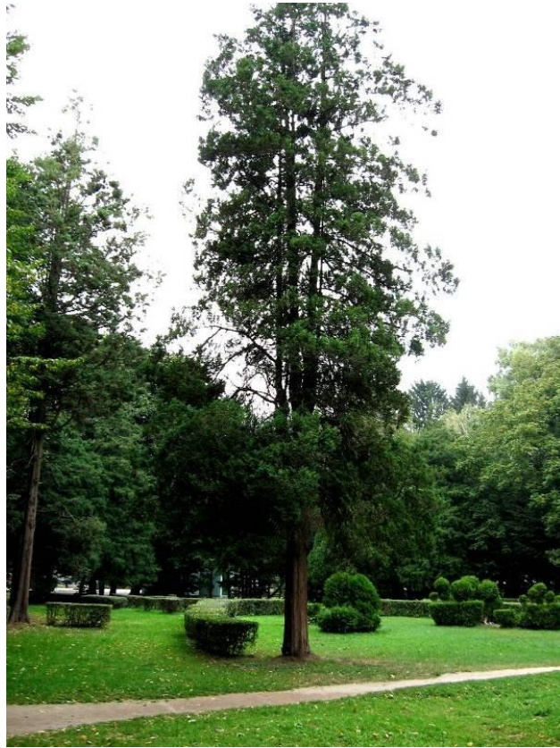
Рис. 4.11. Кипарисовик горохоплідний ф. периста

Слід відзначити, що кипарисовик горохоплідний f. squarrosa сильно пошкоджується низькими зимовими температурами, і можливо, посухою. Пошкоджена хвоя бурого кольору, не відновлюється упродовж вегетаційного періоду. Інші декоративні відміни мають гарний вигляд і можуть рекомендуватися до ширшого використання в озелененні Стрийського парку.