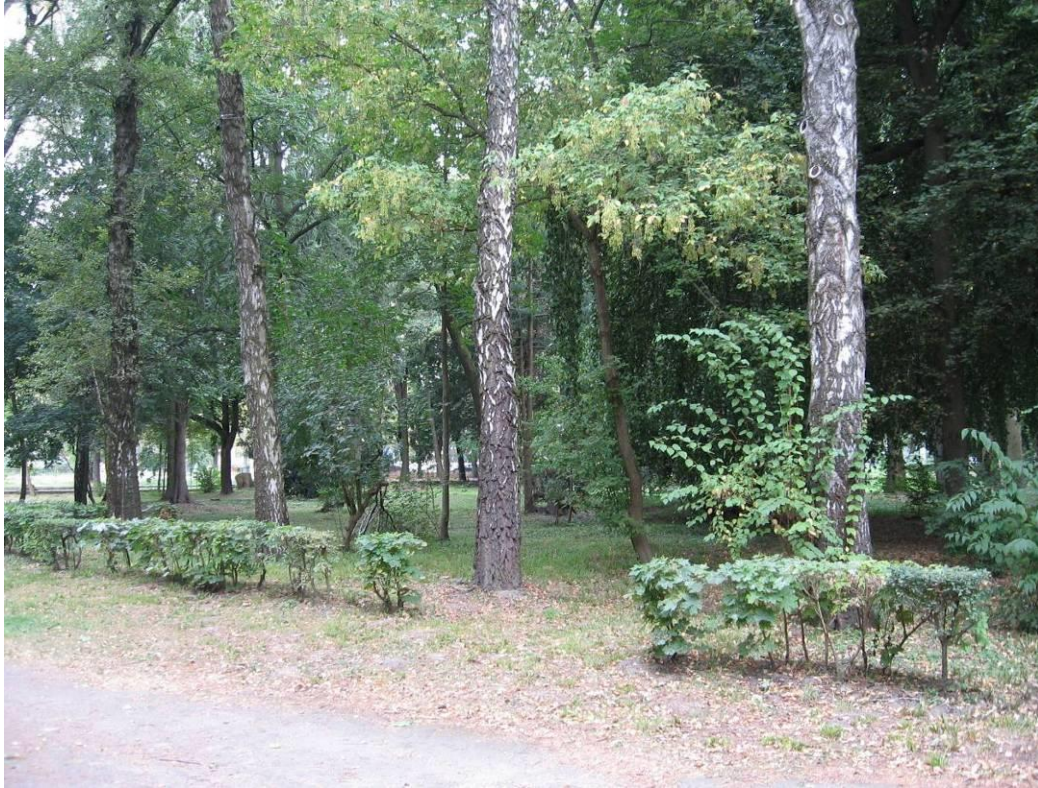
Рис. 4.4. Алея берези повислої в Стрийському парку

тах і навіть на сфагнових болотах; росте на змитих ґрунтах, пісках, супесях, суглинистих і чорноземних ґрунтах, на щебенисто-кам'янистих ґрунтах, виносячи сухість ґрунту нарівні з сосною звичайною (Колесников, 1974; Заячук, 2004).