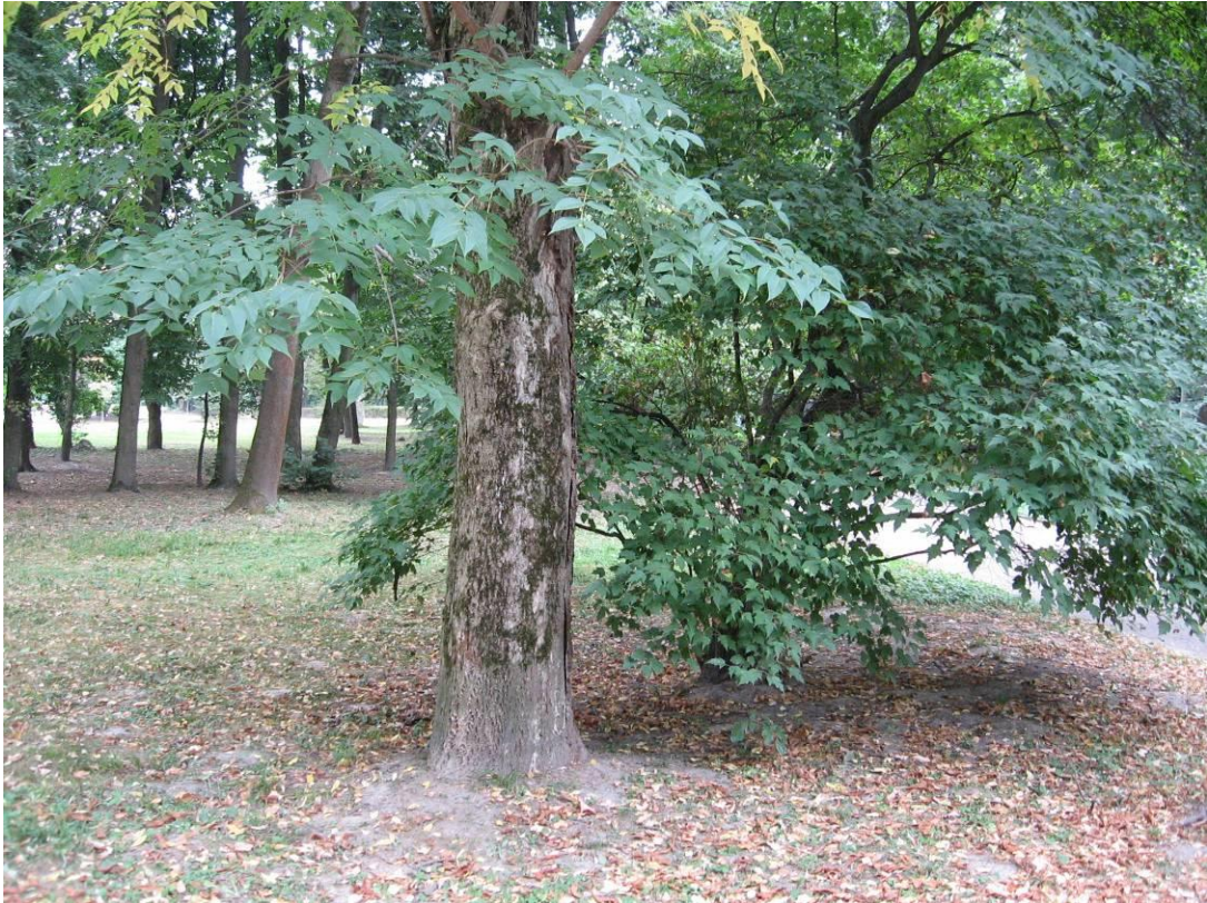
Рис. 4.8. Бархат амурський і клен Гінала

Поблизу ресторану "Супутник" на периферії ділянки колишнього розарію по сусідству ростуть бархат амурський і клен Гінала (рис. 4.8).