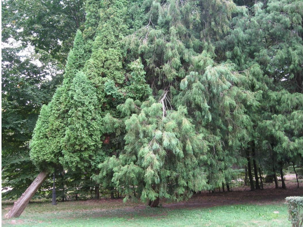
Рис. 4.9. Туя західна і кипарисових горохоплідний ф. нитчаста

Туя західна – Thuja occidentalis L. Дерево заввишки до 15-20 метрів або чагарник з пірамідальною кроною та короткими горизонтальними гілками з плоско розташованою на них хвоєю, без білих продихових смужок на нижній стороні гілочок. Хвоя влітку блискучо-зелена, взимку бурозелена. Шишки яйцевидно-довгасті, завдовжки 1-1,5 см, на коротких черешках, світло-коричневі, шкірясті (Колесников, 1974).