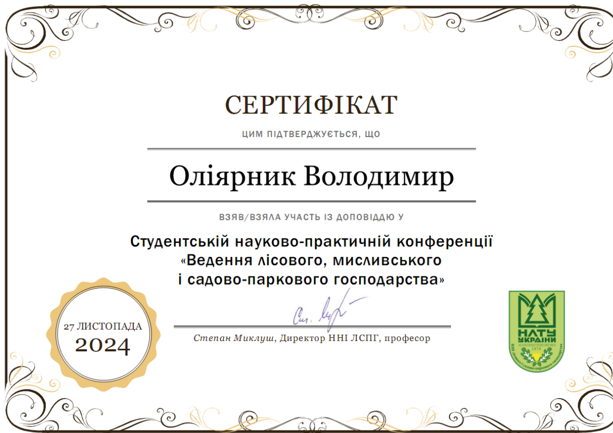
Рис. А.1. Сертифікат учасника студентської науково-практичної конференції.