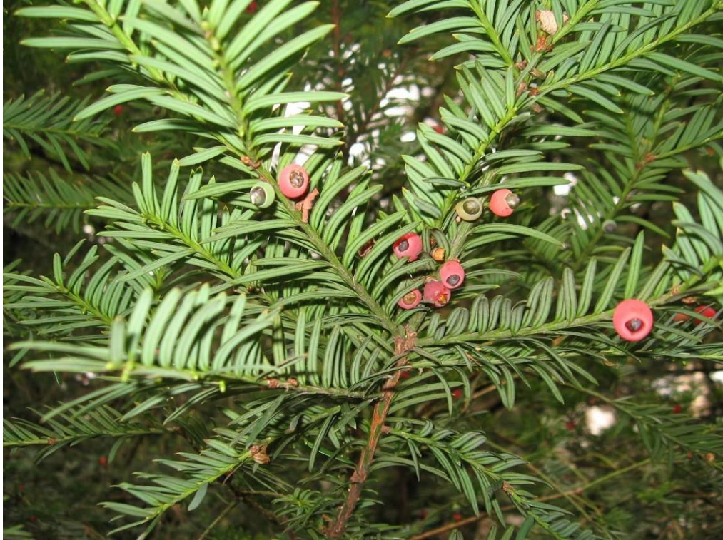
Рис. 4.21. Тис ягідний

На ділянці поблизу будинку садівника росте аралія маньчжурська (чортове дерево) – Aralia mandschurica Rup. et Maxim (рис. 4.22). Найчастіше росте кущем заввишки 3-4 м, рідше невеликим деревом. Стовбур рясно покритий великими колючками. Пагони не гілкуються, але в їх верхівці міститься пучок великих, довжиною 60-120 см, тричіперистоскладних листків. Квітки білі, у великих складнозонтчних суцвіттях. Плоди ягодоподібні, дрібні, сизовато-чорні. Цвіте у серпні–вересні. Застосування: солітером на галявині, невеликими негустими групами, у високому живоплоті (Колесников, 1974).