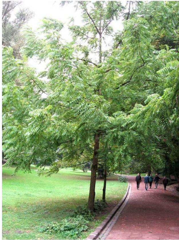
Рис. 4.15. Горіх чорний

Незвично на фоні газону виглядає плакуча форма груші верболистої ( Jugus saliciifolia Pall) (рис. 4.16). Дерево висотою до вісім-десять метрів, гілочки часто закінчуються колючкою. Листки вузьколанцетні, довжиною три-вісім см, шириною 0,5-1 см, молоді сріблясті, пізніше зверху темно-зелені, злегка блискучі, знизу білувато-пухнасті. Квітки білі до двох см у діаметрі, у щитках. Цвіте у квітні-травні. Плоди дрібні, діаметром до двох з половиною см. Посухостійка, до ґрунту невимоглива, переносить засоленість, а також ущільнення ґрунту; димо-і газостійка, але недостатньо морозостійка. Дає велику кореневу поросль (Колесников, 1974). Рекомендується використовувати у вигляді солітерів, в групах, узліссях і живоплотах.