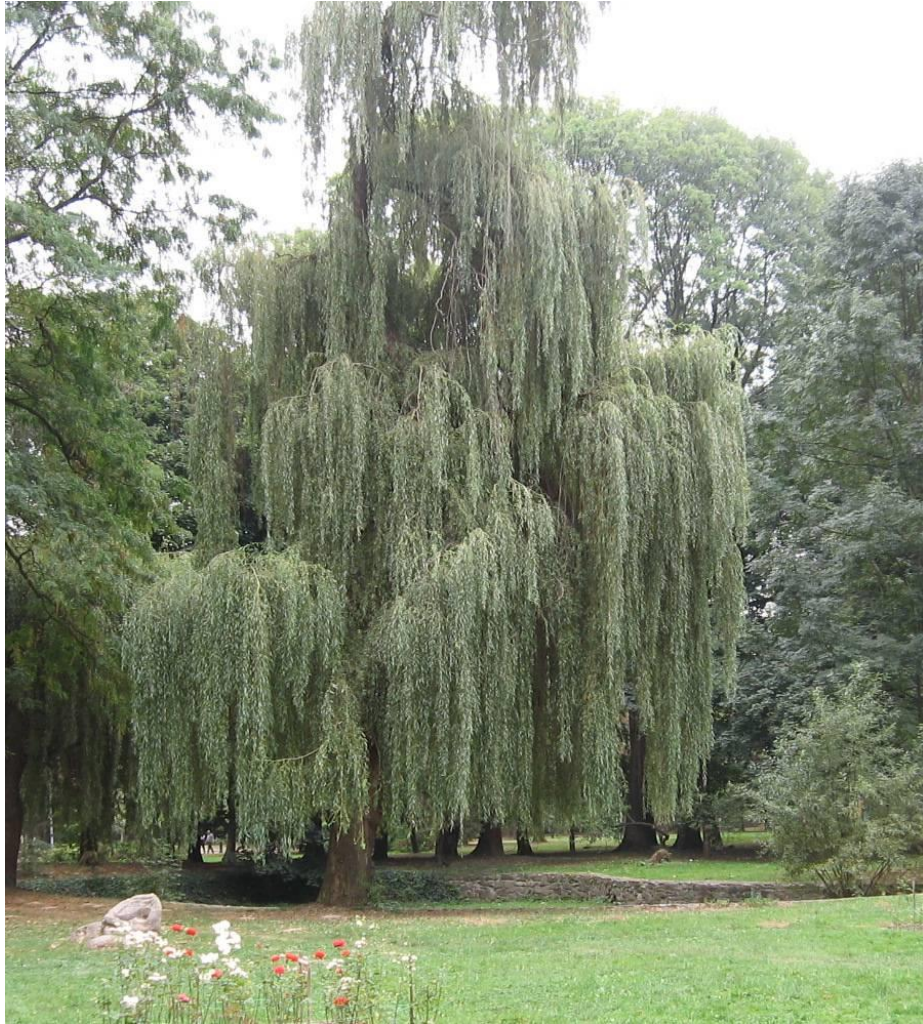
Рис. 4.7. Верба вавилонська

звужені, довжиною 9-16 см і шириною 1-2,5 см, по краях дрібнопильчасті. Молоде листя яскраво-зелене, пізніше зверху зелене, слабо блискуче, знизу сизе. У березні гілки покриваються молодим яскраво-зеленим листям, що зберігає свій свіжий жовтувато-зелений яскравий колір до кінця травня. У цей ранньовесняний період верба вавилонська особливо декоративна; виділяючись своєю яскравою зеленню (Колесников, 1974).