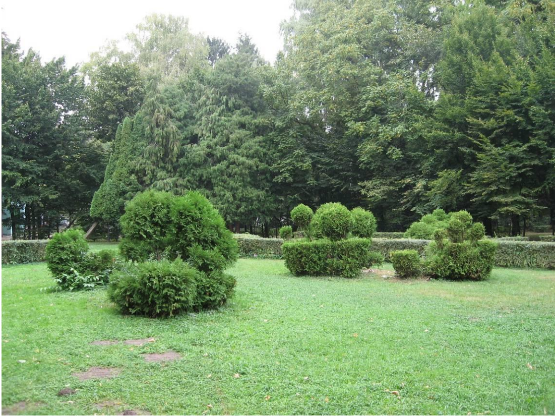
Рис. 4.10. Декоративні відміни та стрижені екземпляри туї західної

ключаючи і територій промислових підприємств (Колесников, 1974).