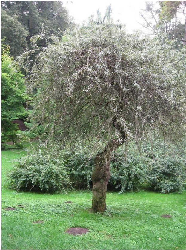
Рис. 4.16. Груша верболиста

Серед деревних рослин із декоративним осіннім забарвленням листя виділяється Клен пальмовидний – Acer palmiatum Thunb (рис. 4.17). Це листопадний чагарник або невелике (6-8 м) деревце. Гілочки голі, тонкі. Листя 5-9-лопатеве або роздільне, довжиною 5-10 см. Квітки пурпурові, пів см в діаметрі, зібрані в маленькі голі щитки . Повільно ростучий теплолюбний вид, витримує короткочасні морози, вимагає родючого, дуже добре дренованого ґрунту. Погано переносить посуху, негативно ставляться до надмірно вологого ґрунту. У Стрийському парку декоративна форма темно-пурпурова – f. atropurpurea – з темно-пурпуровим, грубо двічі пильчастим листям. Клен пальмовидний і його численні форми – дуже вишукані рослини за загальним виглядом, орнаментом листка і яскравим забарвленням. Він може бути окрасою невеликих садів і скверів в одиночній та груповій посадці; придатний також у парках при посадці поблизу доріжок та майданчиків на першому плані (Колесников, 1974).