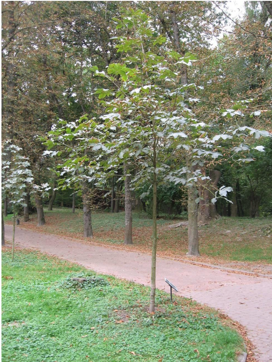
Рис. 4.6. Каштан кінський м'ясо-червоний

На території розарію Стрийського парку поблизу декоративної водойми росте верба вавілонська – Salix babylonica L. (рис. 4.7). Дерево висотою десять-дванадцять метрів, з великою (діаметром до восьми-десяти метрів), красивою, плакучою кроною, з довгими (до 5-6 м), тонкими, що звисають до землі, гнучкими, жовтувато-зеленими, голими, блискучими гілками (Колесников, 1974). Особливо довгі, плакучі гілки мають жіночі екземпляри дерева. Листя вузьколанцетні, з верхівкою, витягнутою в довге вістря, до основи