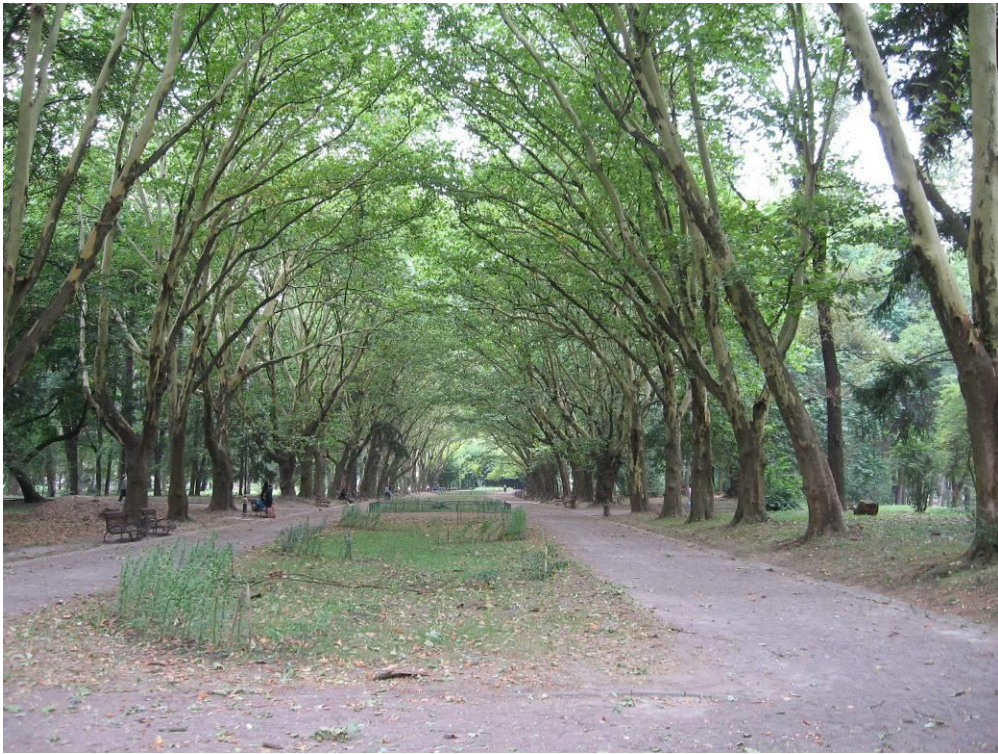
Рис. 4.2. Платанова алея в Стрийському парку

Платан західний є одним із найкрасивіших листопадних дерев. Потужний зріст, гарна форма щільної крони, оригінальне лопатеве листя і оригінальний колір кори стовбура і гілок – такі його основні декоративні ознаки. Якості, що рідко поєднуються – швидкість росту і виняткова довговічність, а також висока якість деревини роблять платан західний дуже цінним деревом для зеленого будівництва і лісового господарства.