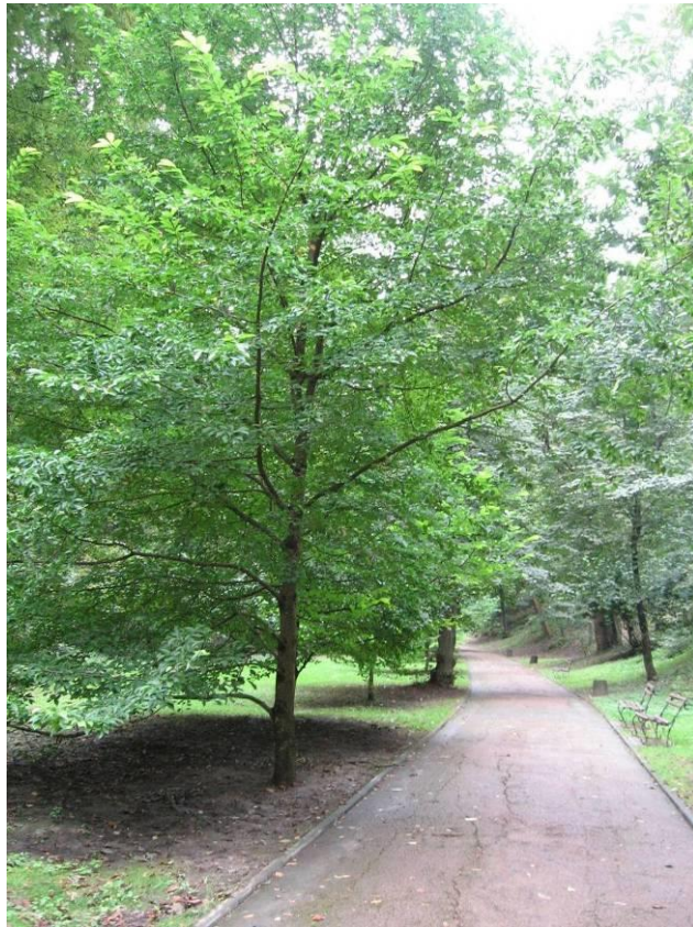
Рис. 4.13. Магнолія кобус

Більш декоративною є магнолія загострена ( Magnolia acuminata L.), яку ще називають огірковим деревом (рис. 4.14). Листопадне велике дерево до 25 м. Листки еліптичні або овальні, довжиною 10-24 см. Квітки невеликі, довжиною 6-8 см, розпускаються у травні-червні, після появи листя. Плоди малиново-червоні. Ця магнолія відрізняється великою морозостійкістю та швидким ростом, заслуговує більшого використання в озелененні в групах та солітерами (Колесников, 1974).