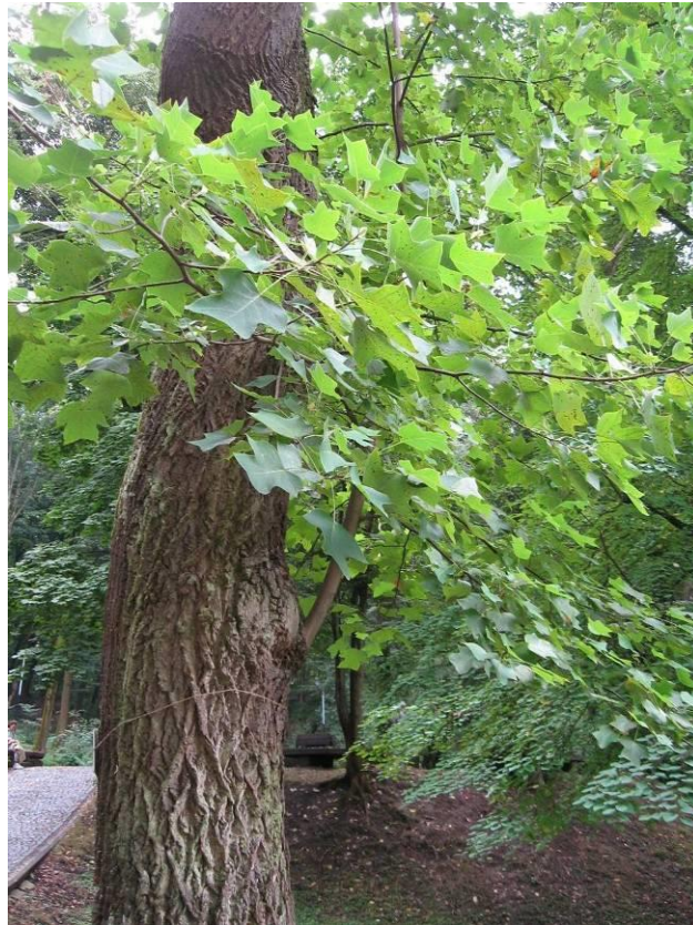
Рис. 4.19. Ліріодендрон тюльпановий

Біля будинку садівника в Стрийському парку росте гінкго дволопатеве – Ginkgo biloba L. Це листопадне дерево, що досягає за сприятливих умов висоти тридцять метрів (рис. 4.20). Листя віялоподібне, часто поділене на дві більш-менш глибокі лопаті, шкірясті, восени перед опаданням забарвлюються в красивий золотисто-жовтий колір. Рослина довговічна, досягає поважного віку. Гінкго завдяки оригінальним листю є досить ефектною декоративною рослиною. У районах, сприятливих для його розвитку у вигляді великого дерева, гінкго може знайти широке застосування в парках-для створення оригінальних груп, в алейних посадках і у вигляді солітерів на газоні (Колесников, 1974).