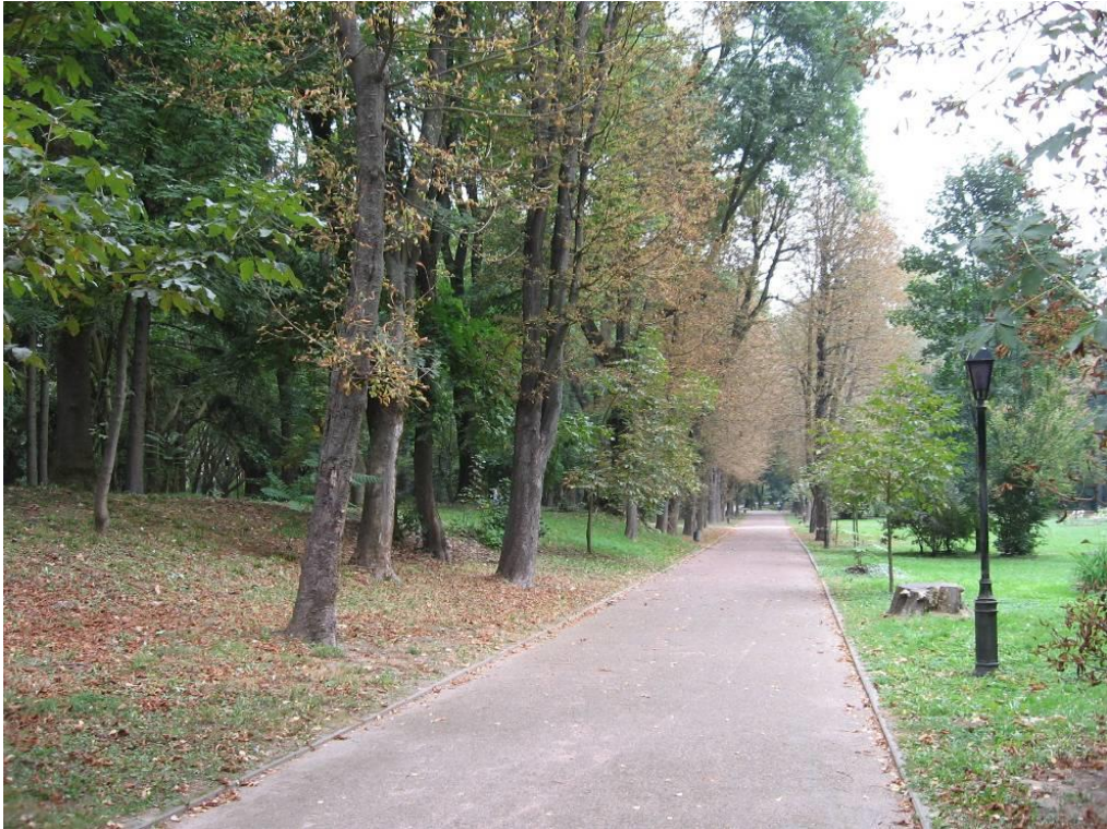
Рис. 4.5. Алея кінського каштану звичайного в Стрийському парку

Недалеко від платанової алеї висаджена алея кінського каштану звичайного ( Aesculus hippocastanum L.) (рис. 4.5).