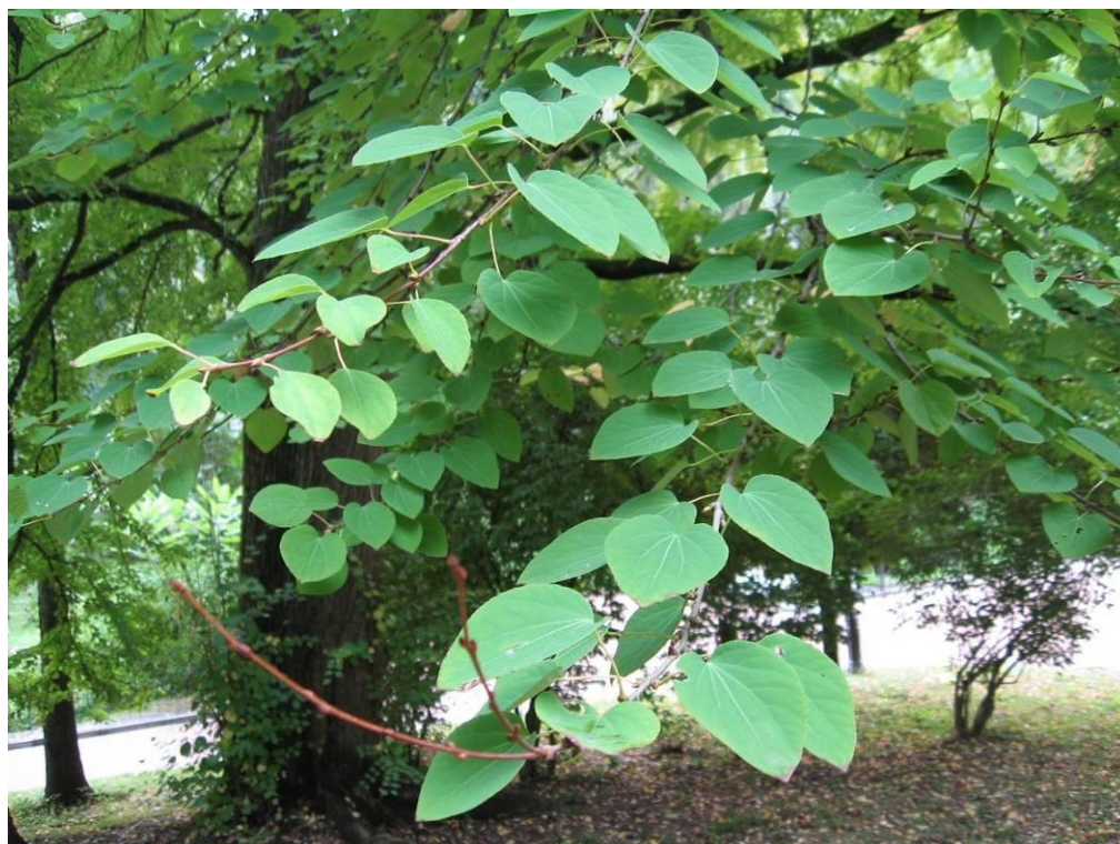
Рис. 4.23. Багряник японський

На схилі південної експозиції над ставком росте багряник японський