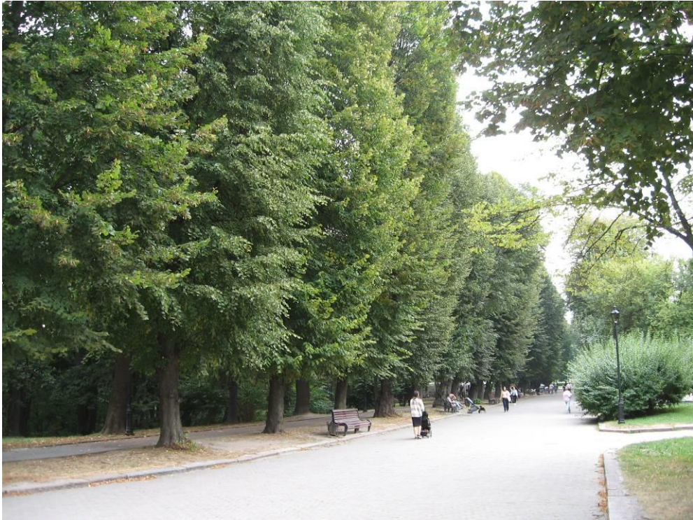
Рис. 4.1. Алея липи дрібнолистої в Стрийському парку

Липа дрібнолиста, або серцевидна ( Tilia cordata Mill.) – це струнке дерево висотою до тридцять метрів, з компактною овальною кроною і стовбуром правильної, циліндричної форми, до півтора метра в діаметрі. Кора у молодих екземплярів (до 40-50 років) гладка, пізніше глибокобороздчаста, темно-сіра.