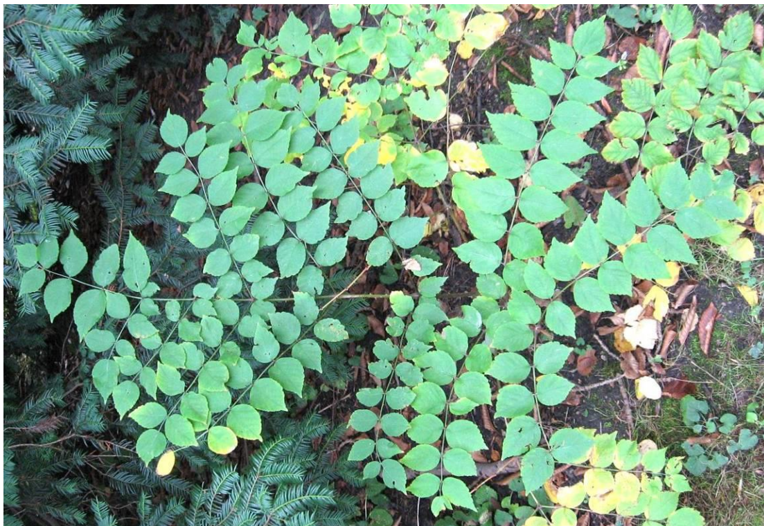
Рис. 4.22. Аралія маньчжурська