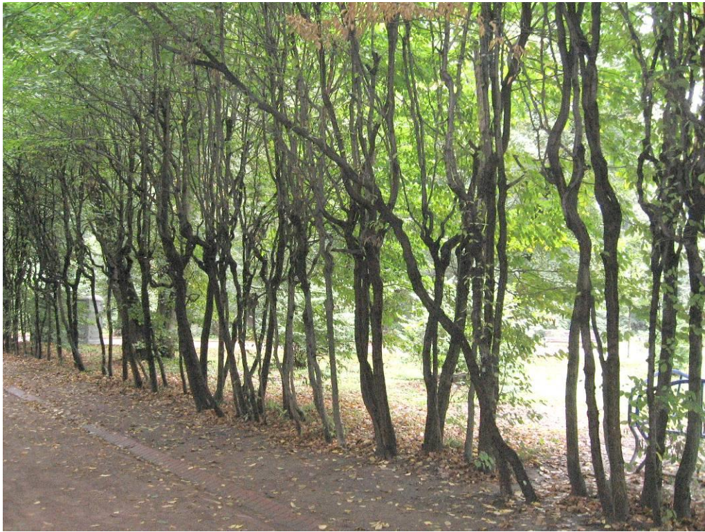
Рис. 4.3. Грабова алея в Стрийському парку

Для створення алей та куртин у Стрийському парку широко використовується береза повисла ( Betula pendula Roth.) (рис. 4.4). Це дерево висотою до 20 (25) м, з ажурною неправильно яйцеподібною або зворотнояйцеподібною - кроною і зазвичай пониклими гілками. Кора стовбура та основних гілок крони у молодих дерев біла, у старих дерев біля основи стовбура вона змінюється чорною глибокотріщинуватою. Листя трикутно-або ромбічно-яйцеподібні, довжиною 3-7 см; у верхівці листя загострене, біля основи ширококлиновидне або майже прямо зрізане, по краях двоякогострозубчасте, листя з обох боків голі; молоді листочки смолисті, липкі; черешки листя тонкі, довжиною 2-3 см. Цвіте в травні, сережки з плодами дозрівають у липні-вересні, після дозрівання розсипаються.