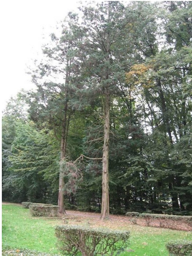
Рис. 4.12. Кипарисовик горохоплідний ф. відстовбурчена

Нижня тераса Стрийського парку більш різноманітна на експозиції деревних рослин. До аборигенних видів, які формують лісові насадження, відносяться бук лісовий, клен гостролистий, клен-явір, ясен звичайний, граб звичайний. Трапляються також декоративні відміни цих видів, зокрема бук лісовий форма плакуча, ясен звичайний форма однолисточкова. На відкритих ділянках багатий асортимент красивоквітучих видів. Серед них виділяється магнолія кобус – Magnolia kobus DC (рис. 4.13). Поширена в озелененні форма північна (f. borealis ) – пірамідальне дерево висотою до 20 м; листя завдовжки до 15 см; квітки до 12 см діаметром, кремово-білого кольору. Цвіте раною весною. В озелененні може бути рекомендована для негустих груп і солітерів у захищених від вітру місцях (Колесников, 1974).