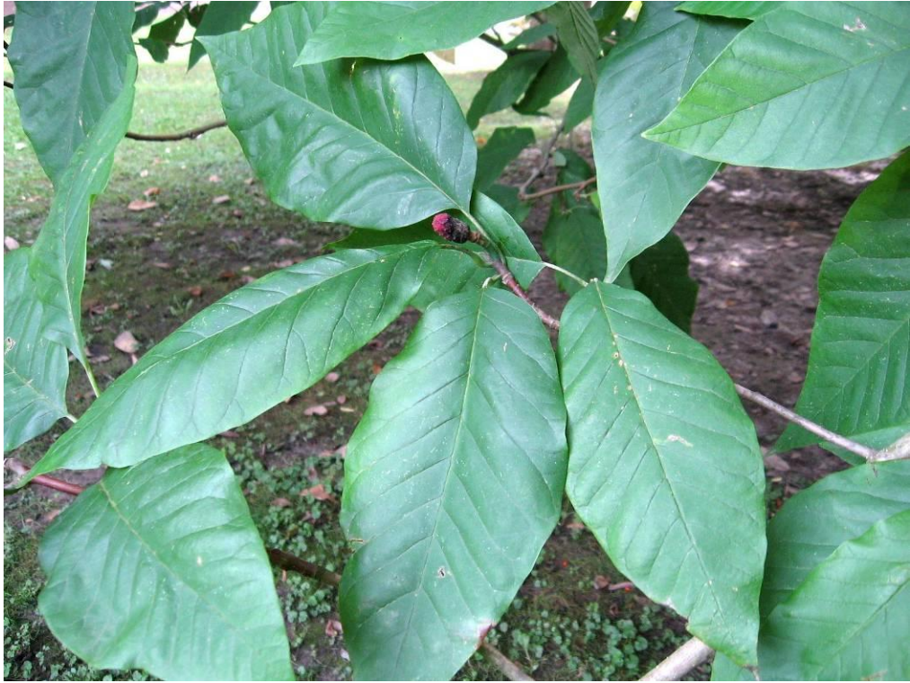
Рис. 4.14. Магнолія загострена

Незвично великими, довжиною до 50 см листками, виділяється горіх чорний ( Juglans nigra L.) (рис. 4.15). Горіх чорний росте швидко, у короткий термін досягаючи розмірів великого дерева. Він менш тіньовитривалий, ніж горіх грецький, але перевершує його за морозостійкістю. Горіх чорний належить до найбільш цінних деревних порід для зеленого будівництва, як дуже красиве, потужного росту, швидкозростаюче і довговічне дерево. Він дуже придатний для швидкого утворення в парках монументальних груп і невеликих масивів як чистих, так і змішаних з іншими (листяними та хвойними) породами. Дуже ефектний він у вигляді солітера на галявині, а також у алейних насадженнях, озелененні доріг та водойм (Колесников, 1974).