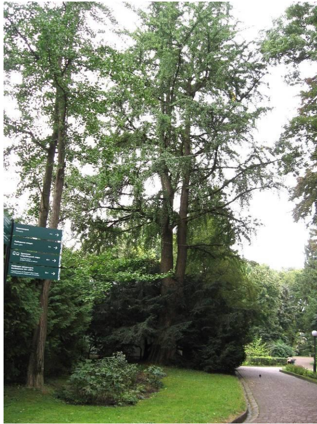
Рис. 4.20. Гінкго дволопатеве

У Стрийському парку часто можна зустріти тис ягідний – Taxus baccata L. (рис. 4.21). Зазвичай це дерево другої величини або кущ. Листя (хвоя) плоскі, лінійні, зверху темно-, знизу світло-зелені. Плоди ягодоподібні, червоні, м'ясисті, кулясті, зверху відкриті. Хвоя тиса отруйна для тварин та людини, плоди не отруйні. Тис ягідний, будучи тіньовитривалою і порівняно вологолюбною рослиною, у культурі задовільно переносить помірно сухі ґрунти та відкрите сонячне розташування. Т. ягідний представляє виняткову цінність для садово-паркового будівництва. Його декоративні різновиди з кронами оригінальних форм та хвоєю різноманітного забарвлення дають найцінніший матеріал для збагачення передніх планів паркових насаджень ефектними солітерами та групами контрастних поєднань. Колоноподібні, пірамідальні, карликові кулясті форми тиса можуть також служити важливою деталлю партерів і гарною прикрасою газонів у внутрішньоквартальних садах та скверах (Колесников, 1974).