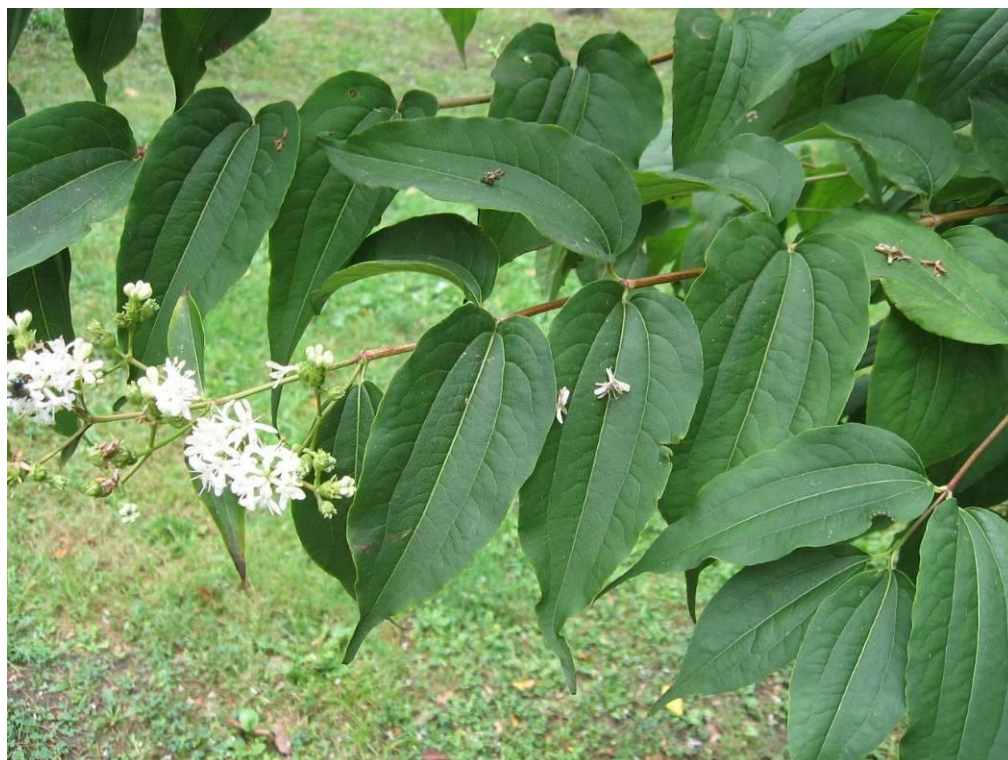
Рис. 4.26. Гептакодiум мiконiєподiбний