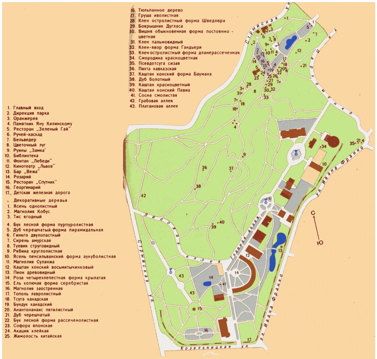
Рис. 2.1. План-схема Стрийського парку (Атлас туриста, 1989)

який давно вже став бібліографічною рідкістю (рис. 2.1).