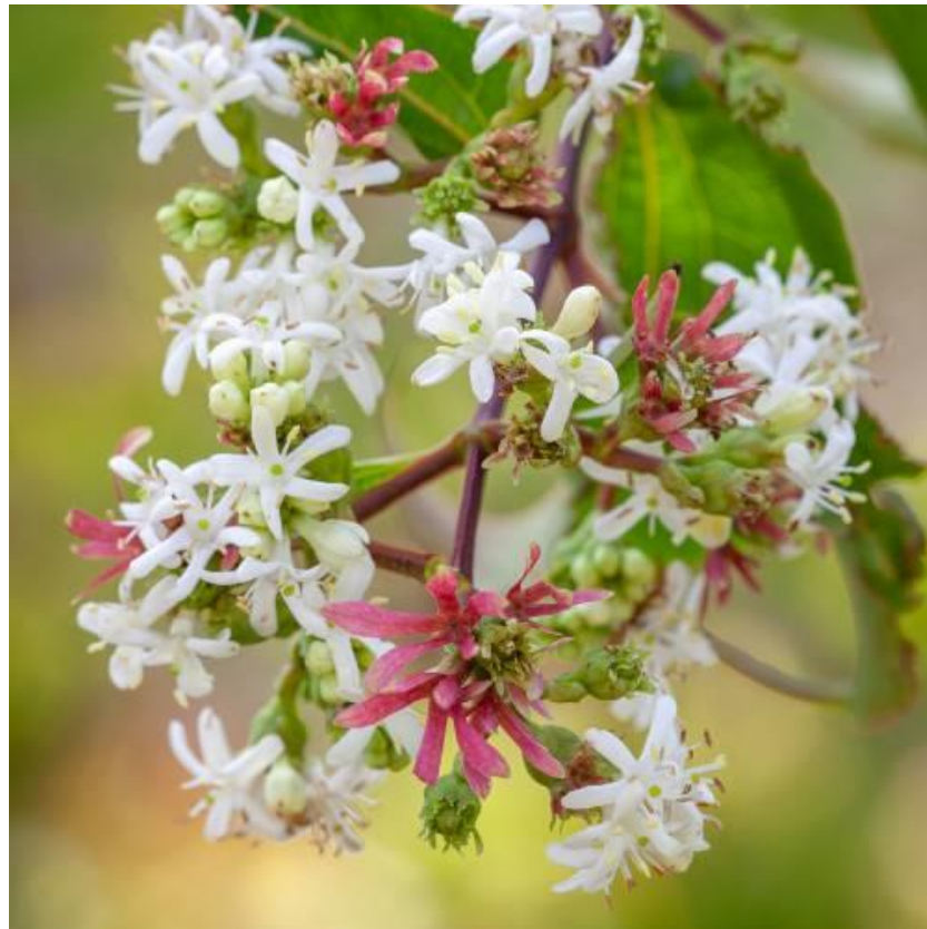
Рис. 4.27. Одночасне цвітіння і плодоношення Гептакодіуму міконієпо- дібного ( Heptacodium miconioides , 2024)

коричнева до коричневої кора, яка відшаровується. Кора помітна здалеку, завдяки чому гептакодіум стане прекрасним зимовим акцентом у саду.