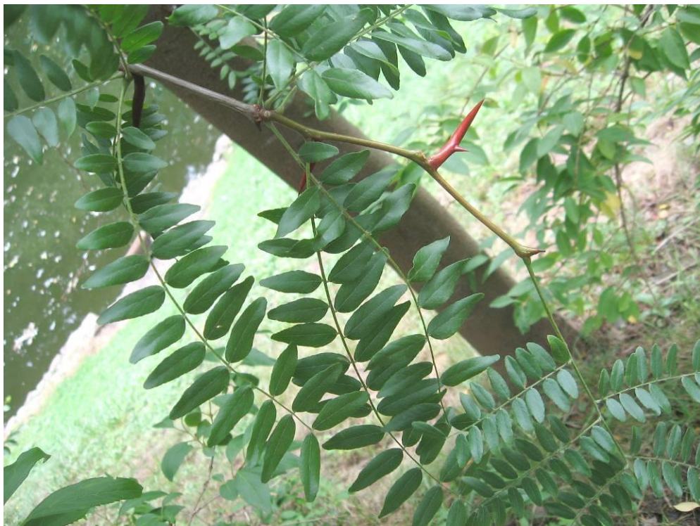
Рис. 4.25. Гледичія триколючкова