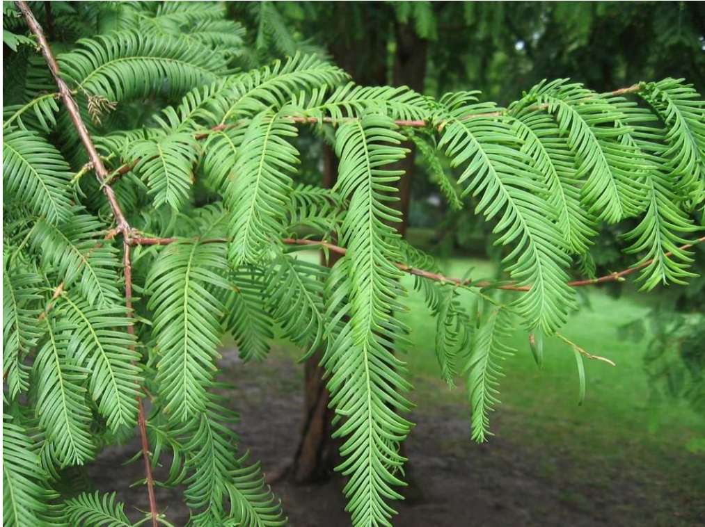
Рис. 4.18. Метасеквойя розсіченошишкова

ми масивами. Особливо ефектна метасеквойя восени, коли її листя задовго до опадіння приймає спочатку золотисте, а потім червонувато-коричневе забарвлення (Колесников, 1974).