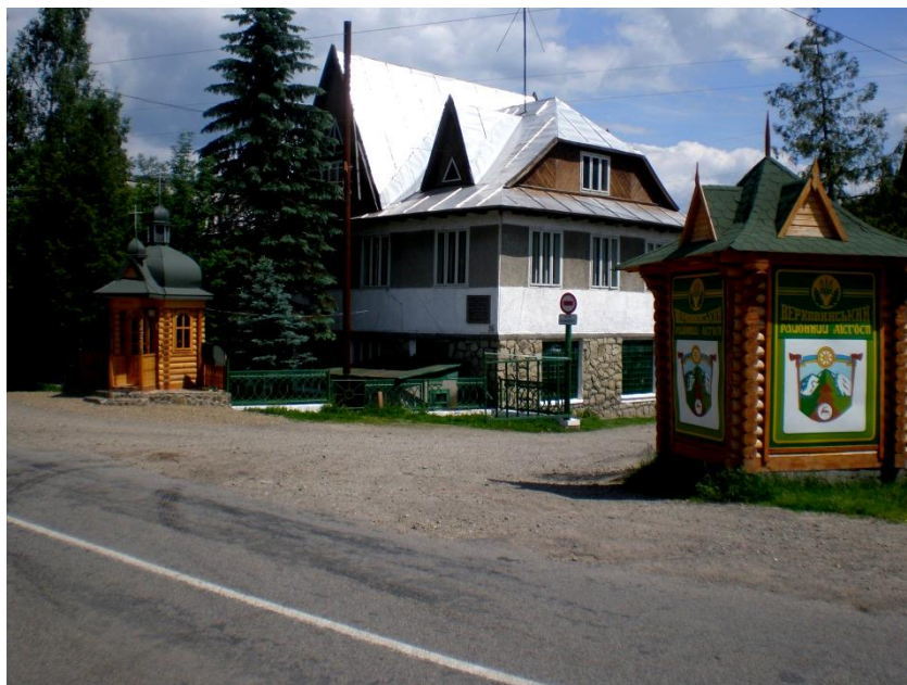
Рис. 2.1. Загальний вигляд садиби Верховинського районного лісгоспу

Загальний вигляд садиби лісгоспу і контори підприємства зображені на рис. 2.1-2.2.