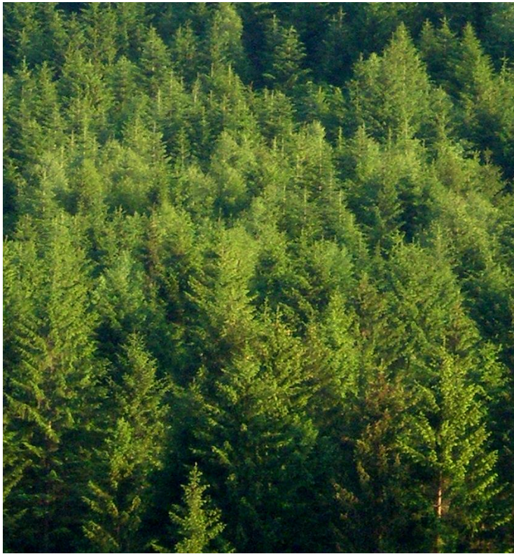
Рис. 3.3. Культури ялини європейської 20-річного віку в умовах вологій буково-ялицевої сусмєречини Верховинського л-ва

гій високогірній сусмєречині та вологій буково-ялицевій сусмєречині на висотах 930-1100 м н.р.м. Відомості про лісовідновні заходи на цих ділянках наведено в табл. 3.6.