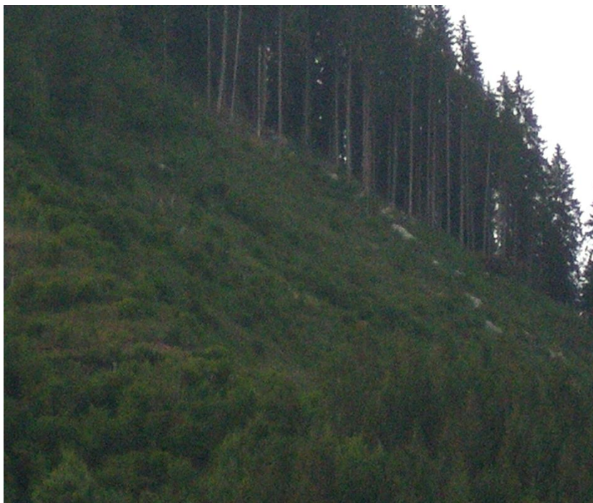
Рис. 3.1. Лісові культури на крутих схилах протиерозійних лісів Верховинського лісництва

На стрімких гірських схилах проводять в основному лісовідновні рубки з наступним створенням лісових культур (рис. 3.1).