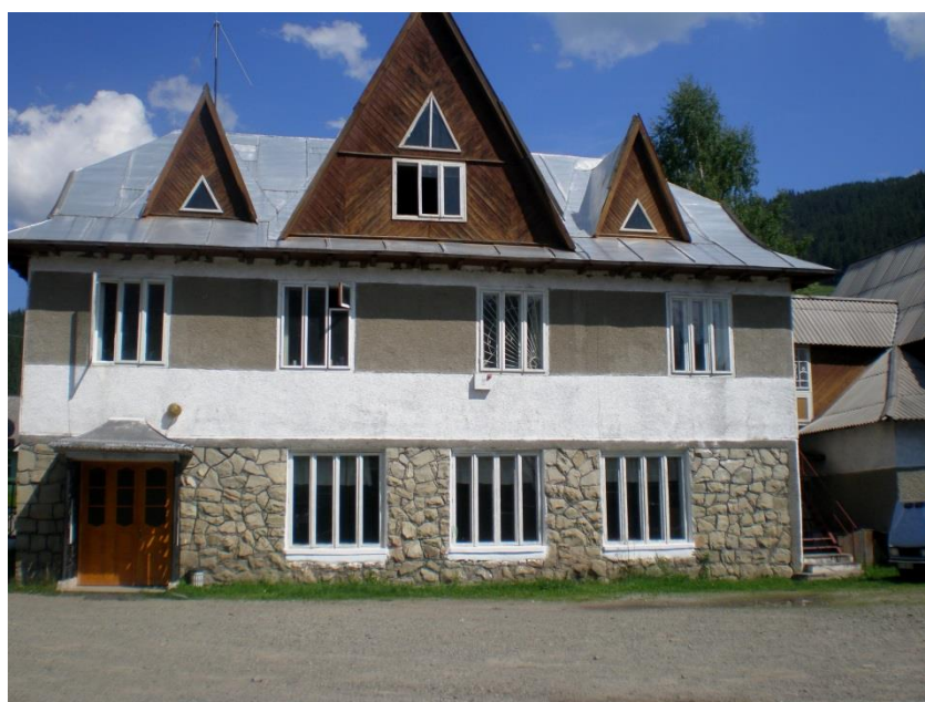
Рис. 2.2. Загальний вигляд контори Верховинського районного лісгоспу