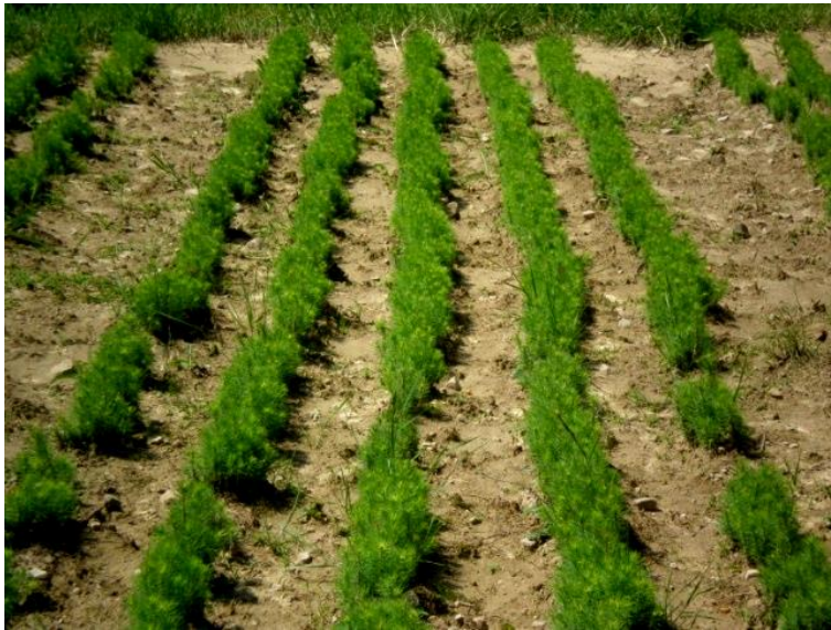
Рис. 3.4. Дворічні сіянці ялини європейської у тимчасовому розсаднику Верховинського л-ва

Постійних лісових розсадників лісгосп не має. В останні п'ять років підприємство активізувало роботу в цьому напрямку, зобов'язавши кожне лісництво вирощувати необхідний обсяг і асортимент садивного матеріалу. Особливу увагу приділяють вирощуванню ялини, ялиці, бука, клена-явора (рис. 3.4).